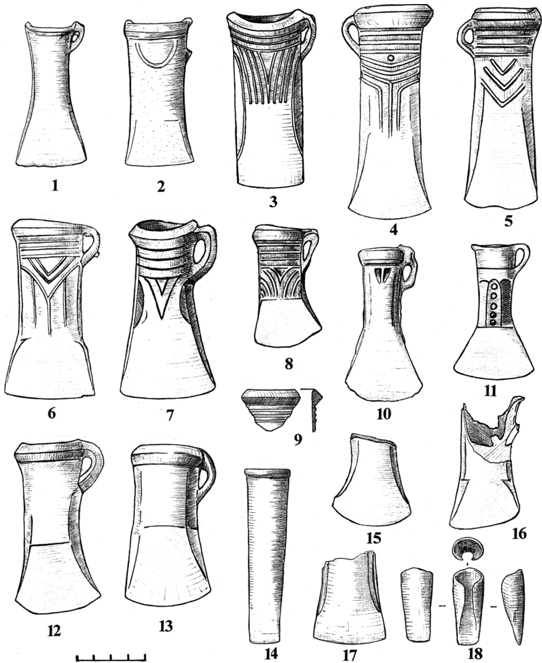
Рис. 2. Кельти з межиріччя Верхнього Сирету та Середнього Дністра (3, 14 – за Г. Смірною; 4–6, 12–13 – за В. Войнаровським і Г. Смірною; 7 – за К. Ромшторфером) Fig 2. Celts from the Upper Siret and Middle Dniester territory (3, 14 – by G. Smirnova; 4–6, 12–13 – by V. Voinarovskij and G. Smirnova; 7 – by C. Romshtorfer)

Від наступного кельту з Коровійського скарбу збереглася нижня частина (рис. 2, 17). Можливо, що його втулка теж була дугоподібною з кілем на кінці. Корпус підпрямокутний з ледь розширеним лезом. Профіль втулки наближений до шестигранного. Найбільша ширина леза дорівнює 4,2 см, розміри збереженої частини втулки – 2,4×1,3 см. До уламків кельтів, очевидно, відносяться ще три незначні бронзові фрагменти зі скарбу.