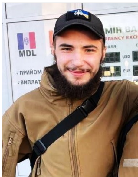
«Рагибор» (# 20)