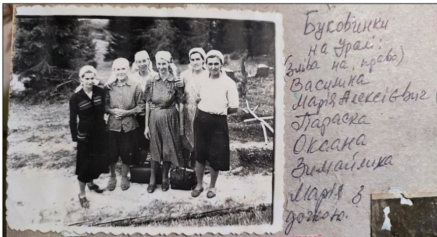
Марія Алексієвич з товаришками по нещастю на Уралі (# 4)