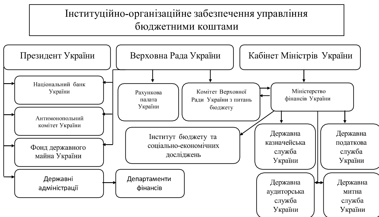
Рис. 1.1. Інституційно-організаційне забезпечення управління бюджетними коштами

Управління бюджетними коштами забезпечується інституційно-організаційною структурою, що складається з учасників бюджетного процесу. Ці учасники, як правило, є органами, установами та посадовими особами, які мають відповідні бюджетні повноваження. (рис. 1.1).