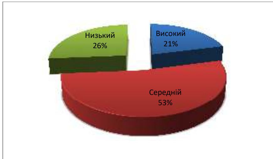
Рис. 3.1 Рівень сформованості учнями 6-х класів граматичних навичок на початку пробного навчання

Розглянемо результати вхідного контролю засвоєння учнями 6-х класів вивчених граматичних тем: