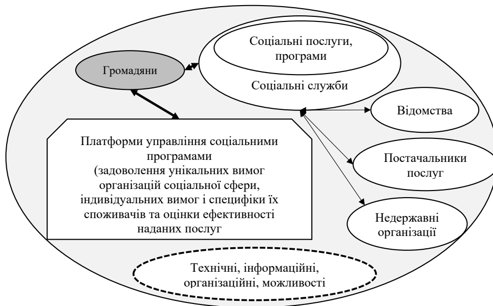
Рис. 2. Модель екосистеми цифровізації соціальної сфери