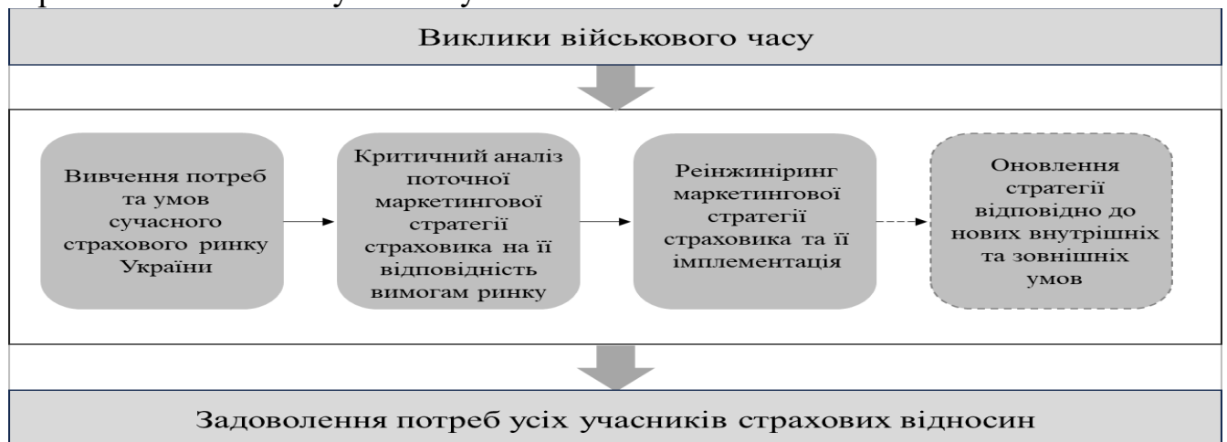
Рис. 1. Базовий алгоритм реінжинірингу маркетингових стратегій страхових компаній в умовах війни

Варто відзначити, що клієнтоцентричність є ключовою особливістю усіх сучасних маркетингових стратегій, основою для розробки яких є вивчення страховиком своєї цільової аудиторії з метою її збільшення. Даний підхід пов'язаний з тим, що в умовах посилення конкуренції, пришвидшення розвитку інновацій та розширення регуляторних обмежень, традиційні маркетингові стратегії є неефективними. Таким чином, можливість створення персоналізованих пропозицій для страхувальників є значною перевагою для страхових компаній в умовах сучасних викликів та змін.