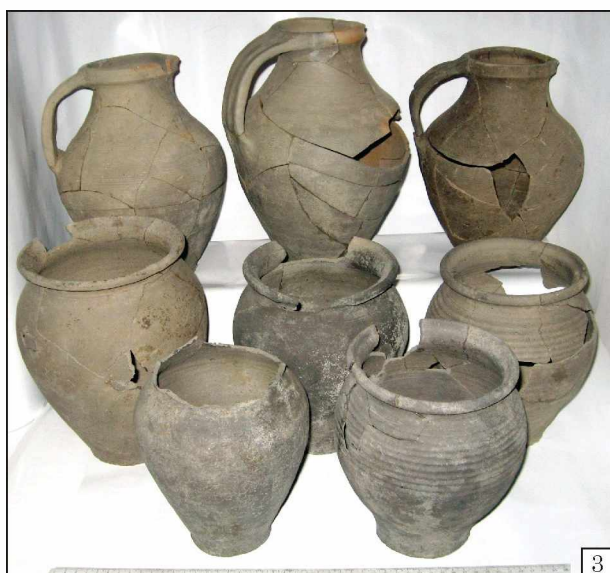
Рис. 2. Рештки гончарного горна з Чернівців (1—2) та зразки керамічного посуду із його заповнення (3)

висотою 0,07 м та шириною 0,18 м. Стінки камери, які місцями збереглися на висоту 0,36 м, звужуються доверху. Прилягаючий до горна ґрунт пропалений до червоного кольору. Аналогічна виробнича споруда по випаленню кераміки була виявлена в Старому Орхеї (Бырня 1981, с. 160).