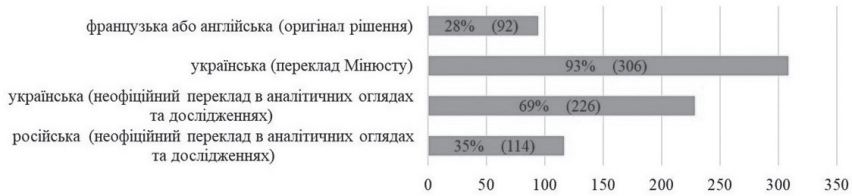
Рис. 5. Мови, що використовуються респондентами для вивчають рішень ЄСПЛ

Для оцінки потреби вдосконалення електронного сегменту в досліджуваній сфері автором представлено кілька ідей технічного вдосконалення, що загалом позитивно оцінені респондентами. На підтримку ідеї щодо запровадження вимоги обов'язкового застосування національним судом гіперпосилання на рішення ЄСПЛ до бази даних ЄСПЛ «HUDOC» при застосуванні практики ЄСПЛ у судовому рішенні висловлюються 67,1% опитаних, 18,9% – не підтримують, 14% опитаним важко відповісти на це питання. Водночас серед суддів дану пропозицію підтримують лише 24,6% респондентів. Вказане технічне вдосконалення можна також розглядати як механізм підвищення релевантності застосування практики ЄСПЛ. Також 87,5% респондентів підтримують ідею створення в функціоналі ЄДРСР додаткового фільтру для пошуку практики ЄСПЛ, що вказує на необхідність технічного вдосконалення ЄДРСР в даному напрямі. Ідею створення порталу дистанційного навчання для постійного вивчення правниками практики ЄСПЛ підтримують 89% опитаних.