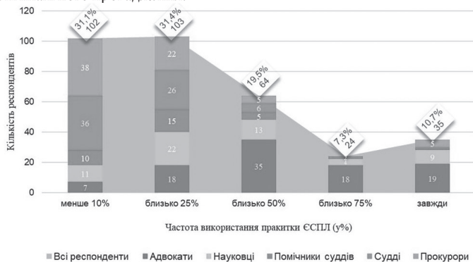
Рис. 2. Частота використання респондентами практики ЄСПЛ під час кримінального провадження

Частота використання респондентами практики ЄСПЛ під час кримінального провадження (за відповідями респондентів візуалізовано на Рис. 2) в середньому становить 36,8%, зокрема: адвокатами – 56,9%; науковцями – 34,8%; помічниками суддів – 29,5%; прокурорами – 24%; суддями – 20,4%. Високі показники використання адвокатами практики ЄСПЛ вказують на її визнання ефективним інструментом захисту прав і свобод людини під час кримінального провадження.