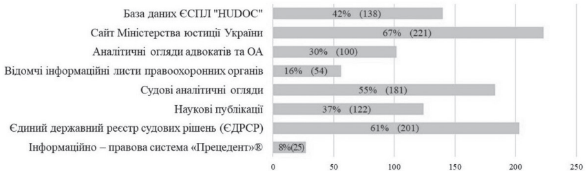
Рис. 4. Інформаційні ресурси, що використовуються респондентами для пошуку практики ЄСПЛ

Для пошуку рішень ЄСПЛ респонденти найчастіше використовують вебсайт Міністерства юстиції України (67%) та ЄДРСР (61%) (див. Рис. 4), відтак їх технічна модернізація щодо удосконалення можливостей з пошуку та аналізу практики ЄСПЛ вбачається найбільш ефективною.