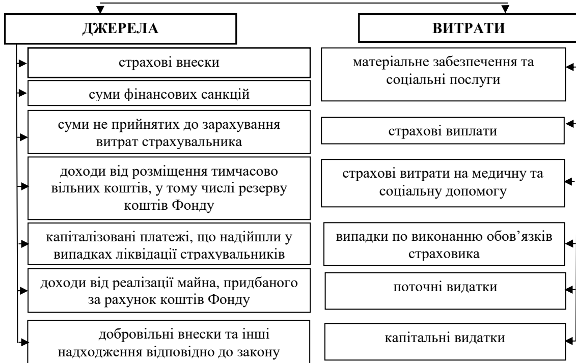
Рис. 1. Бюджет Фонду соціального страхування

Фінансове забезпечення передбачає формування та використання фінансових ресурсів за допомогою оптимізації співвідношення всіх його форм і дає змогу створити такі обсяги фінансових ресурсів, за допомогою яких Фонд мав би змогу функціонувати та забезпечувати свої визначені напрями фінансування [5, с. 225-226].