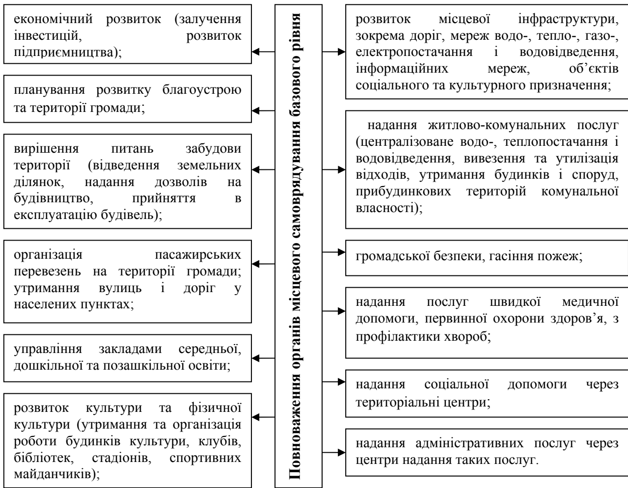
Рис. 1. Повноваження органів місцевого самоврядування відповідно до Концепції реформування місцевого самоврядування та територіальної організації влади в Україні