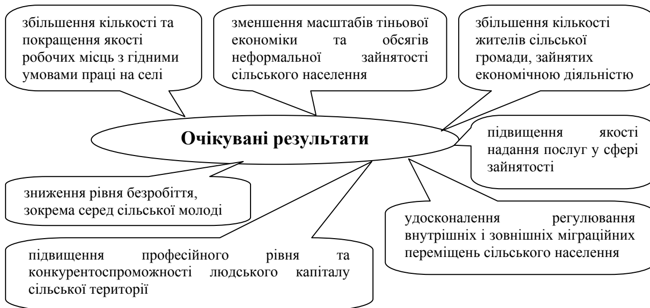
Рис. 3. Очікувані результати від розв'язання проблем у сфері зайнятості сільського населення

Враховуючи вище зазначене, доцільно акцентувати увагу на тому що важливим аспектом для забезпечення соціально-економічного розвитку сільських територій є соціальна, трудова й політична активність сільського населення. Однак у більшості випадків вона знаходиться на пасивно-очікуваному рівні. Россоха В. та Пронько Л. наголошують, що таке ставлення сільського населення що пояснюється рядом причин: «суттєвим розмежуванням в країні соціально-економічних і політичних процесів, ціннісних орієнтацій людей і соціальних очікувань; недостатньою інформованістю частини населення про причини кризового стану, сутність ринкових відносин, конкретних шляхів прояву власної ініціативи в цих умовах; низьким рівнем політичної й моральної довіри до колишніх і нині сформованих інститутів влади, партій і рухів; нестачею реального досвіду, переконливих і успішних дій в умовах ринкових відносин; страхом перед безробіттям, вадами соціальної інфраструктури, сфери культури і дозвілля, нормального побуту, соціальної захищеності тощо. [12, с. 124–135].