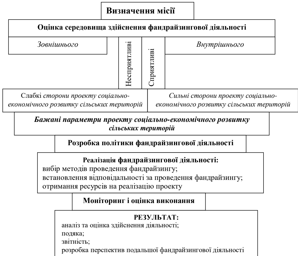
Рис. 3. Алгоритмізована модель фандрайзингової діяльності на сільській території