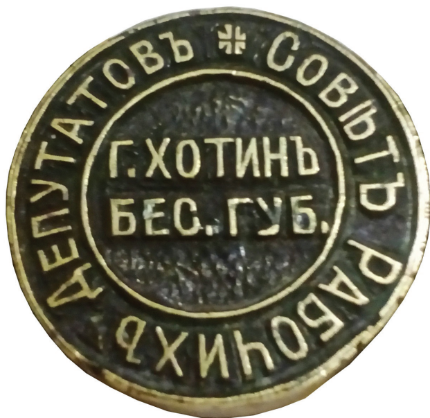
Фото 1. Печатка ради робітничих депутатів м. Хотин Бессарабської губернії (дзеркальне зображення).

У Хотині, Новоселиці та Бричанах з претензією на виняткове представництво трудящих виступили ради робітничих депутатів, створені у березні 1917 р., а в Романківцях, Сокирянах, Кельменцях, Данківцях, Стальнівцях, Грозинцях й інших населених пунктах – ради селянських депутатів. Більшість у радах, які повністю