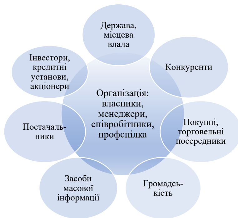
Рис.1. Ключові внутрішні та зовнішні стейкхолдери організації