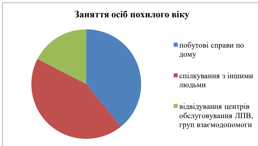
Рис. 3. Провідні заняття осіб поважного віку

на ситуацію коли в таких умовах обмежать коло безпосереднього спілкування і перейдуть на онлайн спілкування чи на телефонне. 5% опитаних вважають, що маючи медичну освіту зможуть допомогти у профілактиці поширення вірусу, а ще 20% уникнули відповіді.