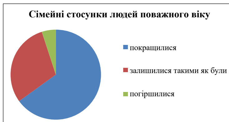
Рис. 4. Сімейні стосунки людей поважного віку