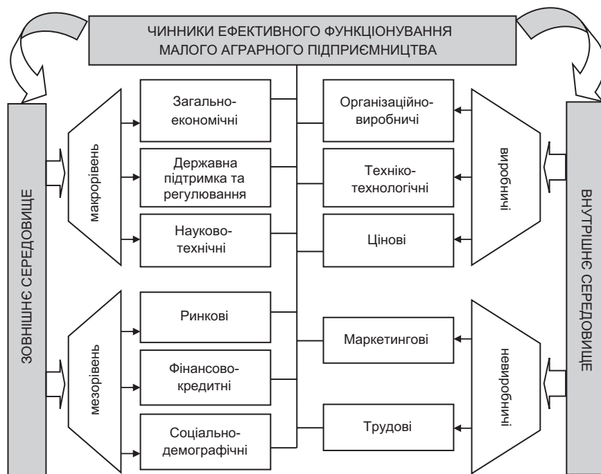
Рис. 2. Чинники ефективного функціонування малого аграрного підприємництва

Проте нині державна аграрна політика у цій сфері нагадує сукупність неузгоджених між собою заходів, спрямованих на вирішення короткотермінових проблем