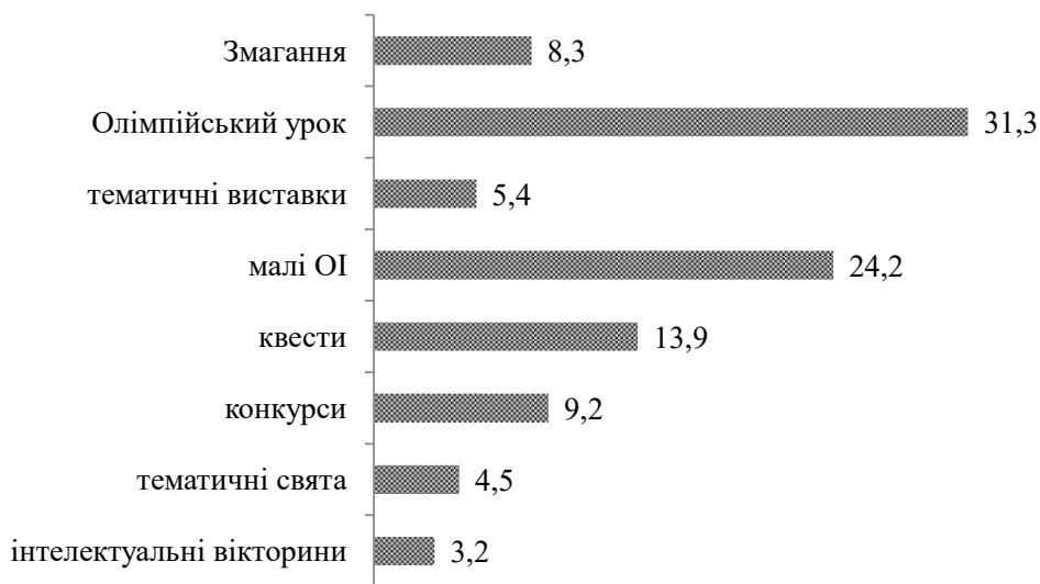
Рис. 2. Пріоритетні засоби олімпійської освіти школярів