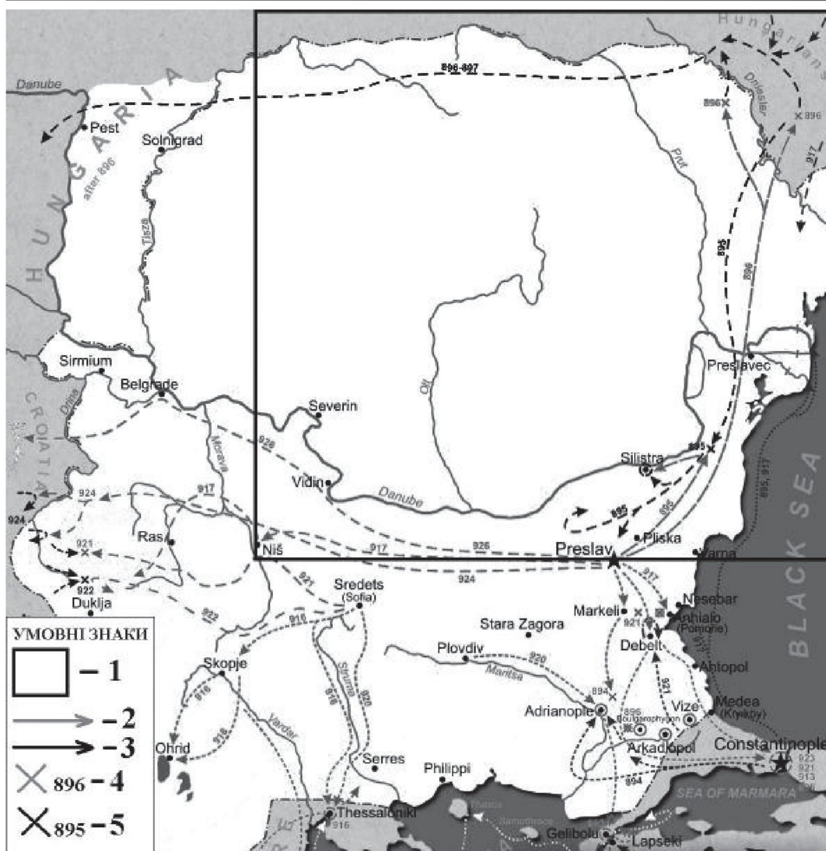
Рис. 2. Війни царя Симеона I Великого (893-927 рр.): 1 – територія ведення бойових дій між болгарсько-печенізькими та візантійсько-угорськими військами у кінці ІХ ст.; 2 – походи військ царя Симеона в Подністров’я та Побужжя (894-896 рр.); 3 – бойові дії візантійсько-угорських військ (894-896 рр.); 4 – місця битв, які завершилися перемогою об’єднаної коаліції болгар та печенігів; 5 – місця битв, які завершилися перемогою візантійсько-угорського війська.