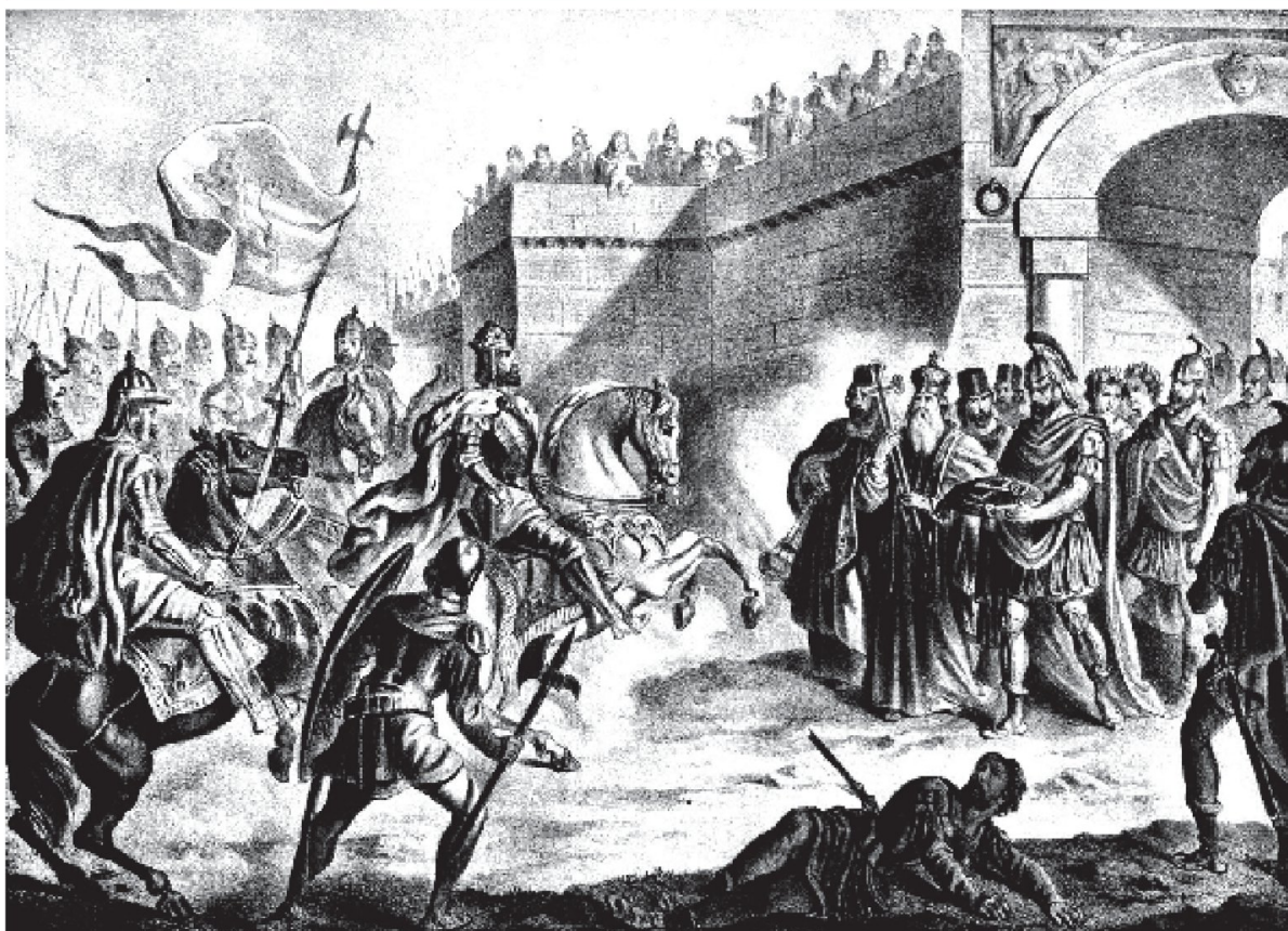
Рис. 1. Болгарський цар Симеон I Великий біля воріт Константинополя (за картиною Н. Павловича, 1917 р.)

угрів окремо. Пізніше болгарський правитель ув'язнив Лева. Виступивши в похід проти угрів, коли вони не отримували допомоги від візантійців і були покинуті Левом, цар Симеон знищив їх та спустошив усю їхню землю, що ще більше налякало сусідів болгар. Повершувшись, він знайшов Лева (хойросфакта) в м. Мудагра (Μουδάγρα) і заявив, що не укладе миру, поки не отримає усіх полонених. Пізніше усі полонені були повернуті до Болгарії [5, с. 91-94].