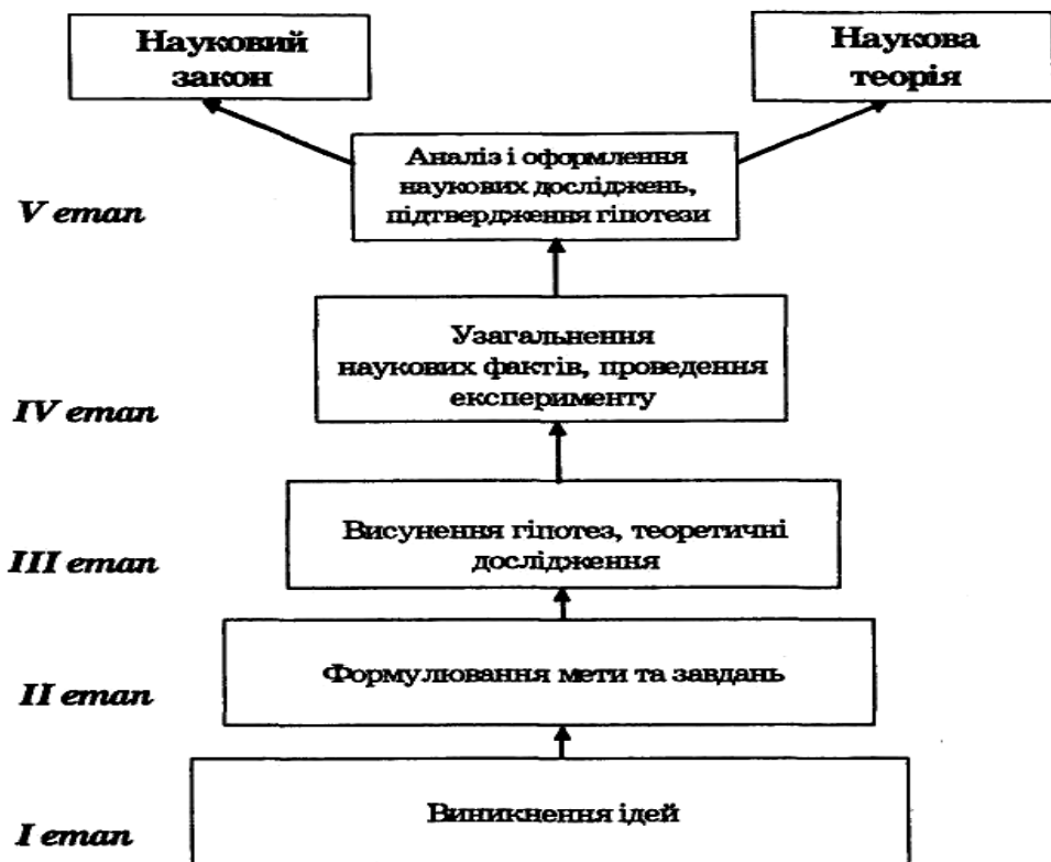
Схема 1. Головні етапи наукового дослідження.

- визначення ефективності наукового дослідження;