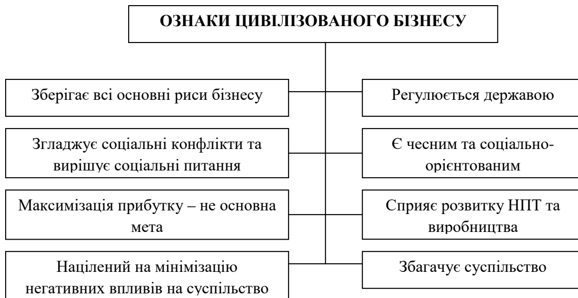
Рис. 2. Ознаки цивілізованого бізнесу

Можна виділити ознаки, якими наділений цивілізований бізнес (рис. 2).