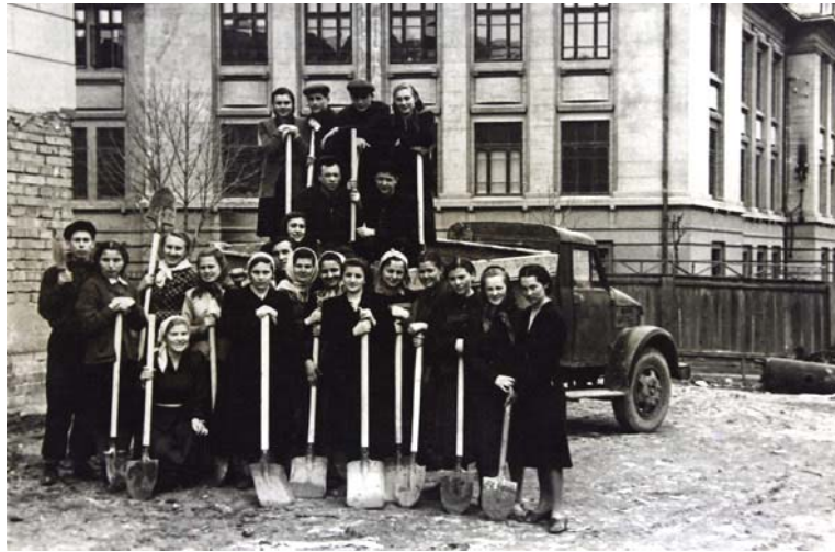
1955 р. Недільник. На будівництві університетської бібліотеки.