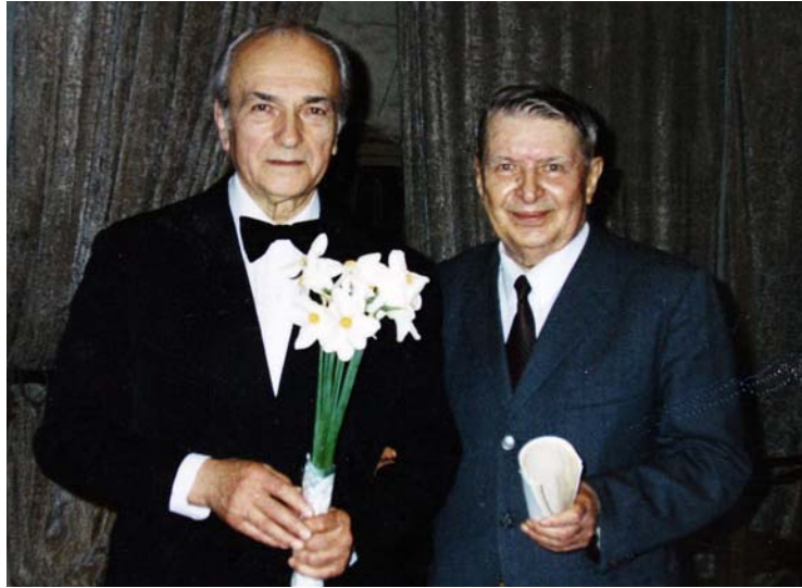
20 квітня 2002 р. Після концерту народного артиста України, професора Ю. Гіни