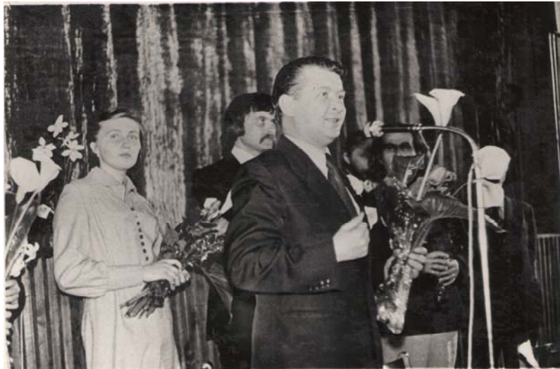
Виступ А. Добрянського на вечорі Івана Миколайчука