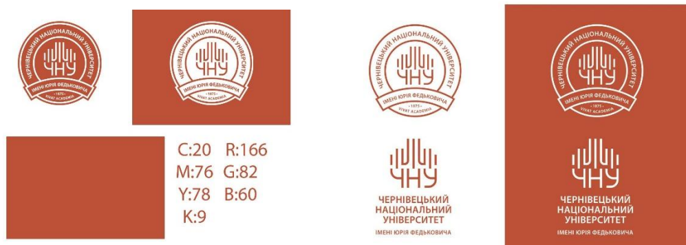
Рисунок 5 – Затверджений новий логотип Чернівецького національного університету імені Юрія Федьковича

Завершальними кроками другого етапу стали презентація результатів роботи експертів та журі бліцконкурсу, ухвалення логотипу-переможця офіційним логотипом університету і нагородження автора логотипа-переможця обіцяними призами (рисунок 5).