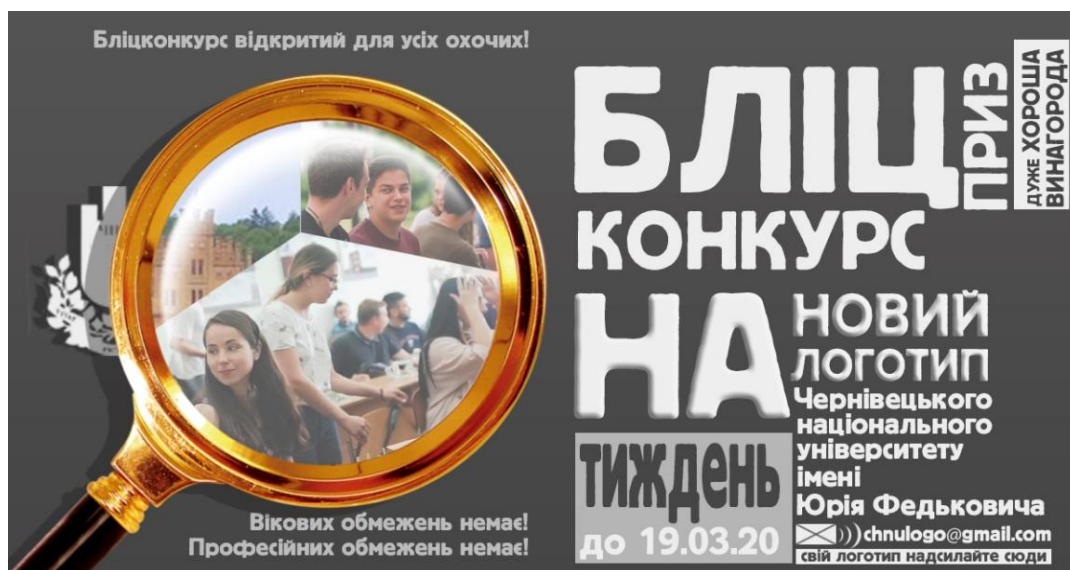
Рисунок 1 –Макет рекламного постеру бліцконкурсу на новий логотип Чернівецького національного університету імені Юрія Федьковича