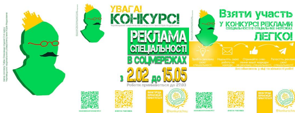
Рисунок 7 – Логотип поданий на бліцконкурс і його використання у брендуванні конкурсу реклами спеціальності в соціальних мережах

Але, крім вдалого досвіду у проведенні бліцконкурсу Чернівецьким національним університетом імені Юрія Федьковича – отримання логотипу, були й інші позитивні результати. Серед поданих ескізів логотипів були такі, які чудово підходять для брендування окремих подій, які відбуваються в університеті. Так, один із конкурсних логотипів став логотипом іншого конкурсу ЧНУ імені Юрія Федьковича, який був ініційований відділом інформаційної діяльності та комунікацій в лютому 2021 р. – «Конкурс реклами рідної спеціальності в соцмережах» (рисунки 7). Ім'я автора вказували на усіх рекламних постерах – ним виявився студент Чернівецького національного університету імені Юрія Федьковича.