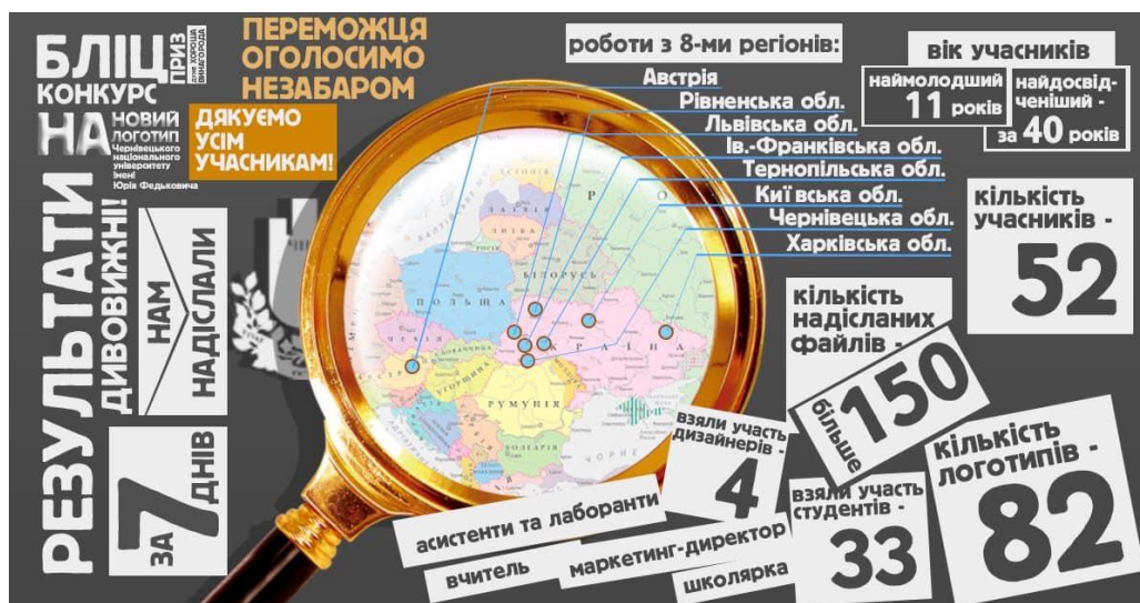
Рисунок 2 – Макет рекламного постеру інфографіки результатів бліцконкурсу на новий логотип Чернівецького національного університету імені Юрія Федьковича

Перший етап бліцконкурсу показав неочікувані результати, які у кількості надісланих робіт перетнули показники усіх подібних конкурсів, що організовувалися в ЧНУ імені Юрія Федьковича за останні роки (рисунок 2).