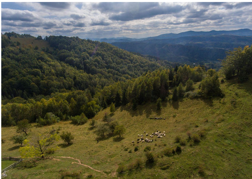
Додаток Е. Давні та споконвічні букові ліси Карпат та інших регіонів Європи