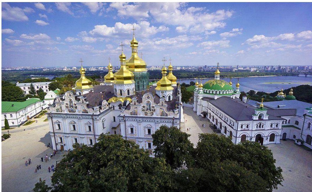
Додаток А. Собор Св. Софії і прилеглі монастирські споруди, Києво-Печерська лавра