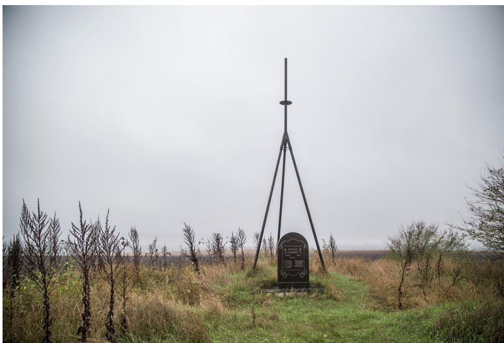
Додаток Д. Геодезична дуга Струве