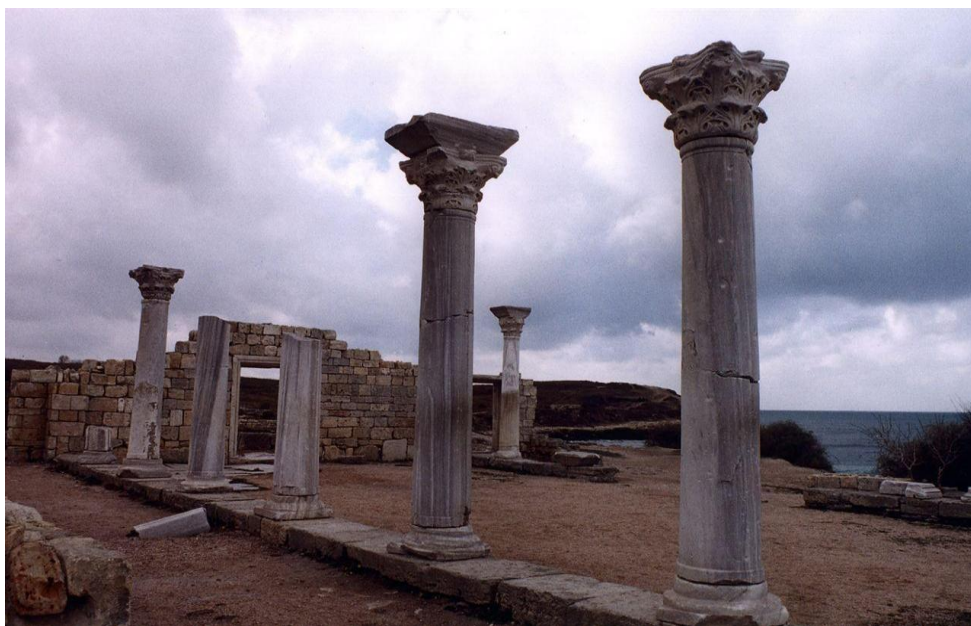
Додаток Г. Таврійський Херсонес