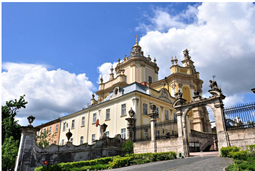
Додаток С. Собор Святого Юра