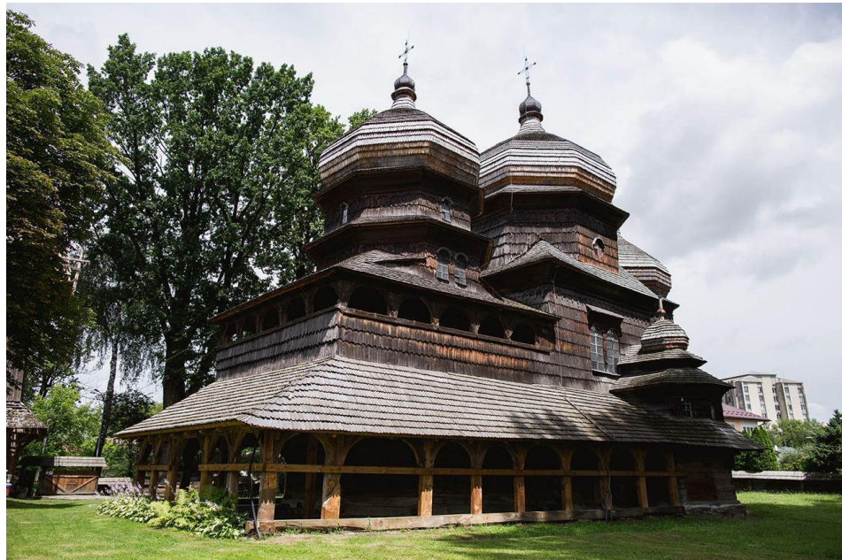
Додаток. Н. Дерев'яні церкви карпатського регіону Польщі та України