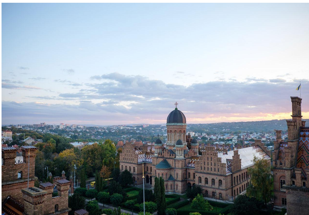
Додаток Ф. Резиденція митрополитів Буковини і Далмації