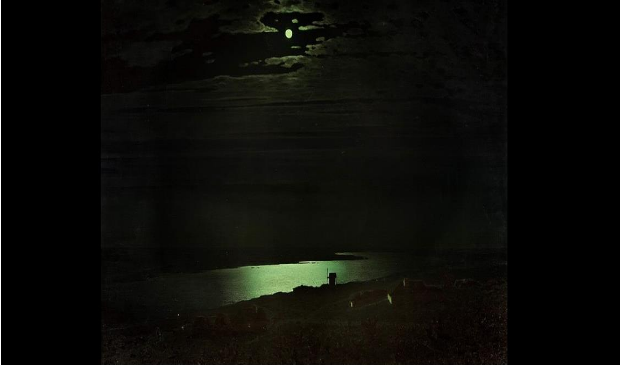
. Картина А. Куїнджі «Місячна ніч на Дніпрі»

Це особлива картина, її було виставлено в 1880 році в Санкт-Петербурзі, причому вона була єдиною картиною, котра склала виставку. Щоб побачити полотно, люди шикувалися в чергу, багато відвідували виставку не по одному разу. Відвідувачів приваблювала незвичайна реалістичність світу на картині, багато висловлювали припущення про незвичайні фарби, що використані художником, деякі навіть заглядали за картину, намагаючись з'ясувати, чи немає там лампи [30].