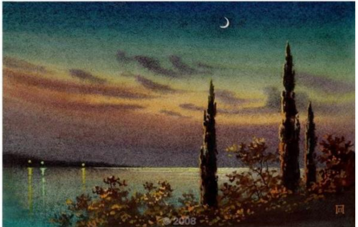
Картина П. Парамонова Морський пейзаж

Тут чітко зображено молодий місяць (перша чверть), якщо провести умовну лінію через кінці серпу до лінії горизонту, то отримуємо напрям на південь.