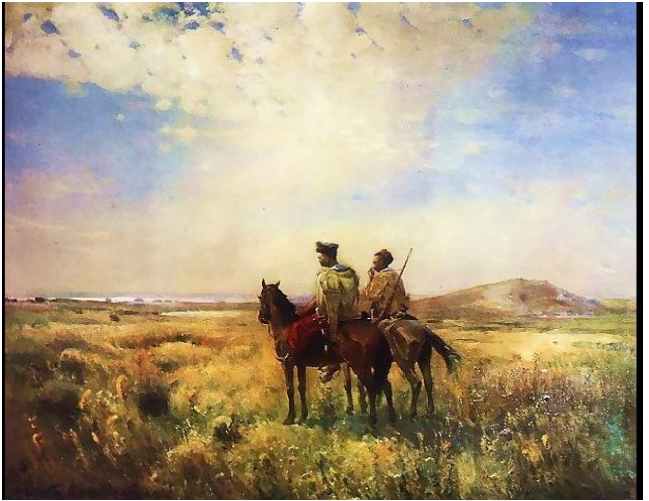
Картина С. Васильківського «Вартові Запорізьких вольностей».

Розглянемо для прикладу картину С. Васильківського «Вартові Запорізьких вольностей».