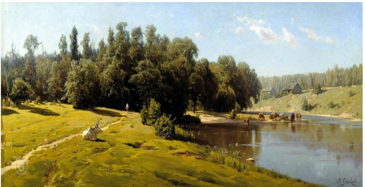
Картина В. Орловського «Полудень»

сторін горизонту), у полудень на півдні і заході на заході. Отже для приблизного визначення сторін горизонту достатньо пам'ятати, що в ранці воно знаходиться у східному секторі неба, в середині дня - в південному та у вечері - у західному. Час доби можна приблизно визначити за висотою сонця над горизонтом та за довжиною тіней від вертикальних об'єктів. На картинах художники не завжди зображують сонце, але за характером освітлення місцевості, та окремих об'єктів можна виявити його положення.