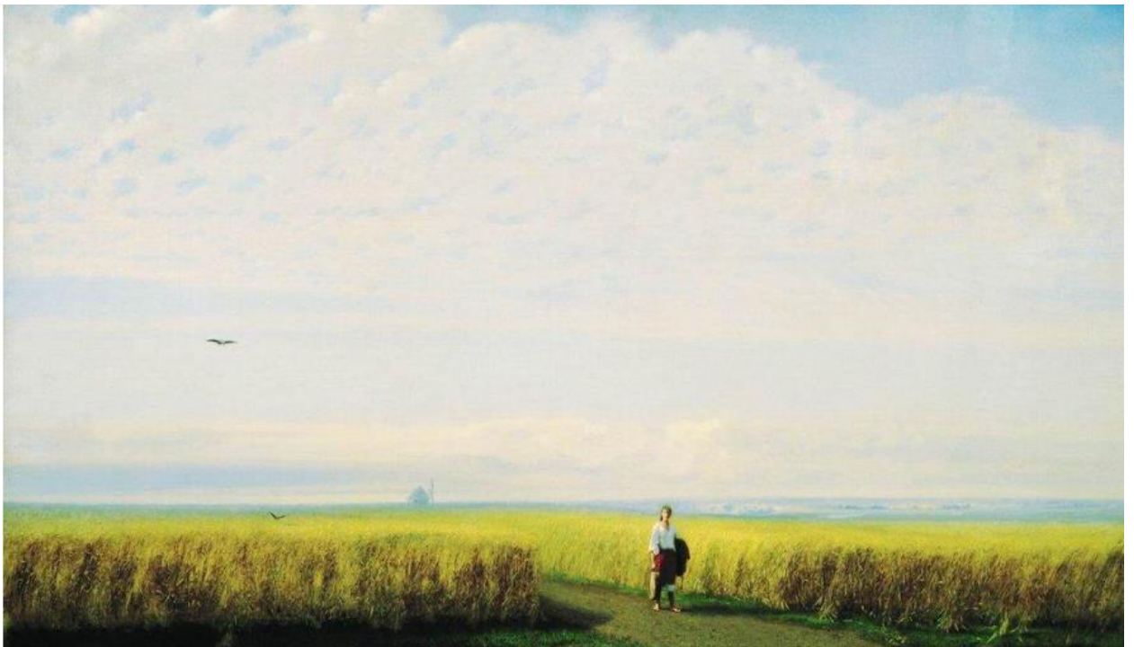
Картина А.Куїнджі «Степ. Нива»

1. Картина «Вечір в Україні» видатного українського та російського пейзажиста К.Я. Крижицького була написана в 1901 р., тобто більш ніж 100 років тому, але мальовнича українська природа не втратила своєї привабливості і зараз вона продовжує дивувати особливим ліричним настроєм, що створюється завдяки виразному поєднанню компонентів ландшафту.