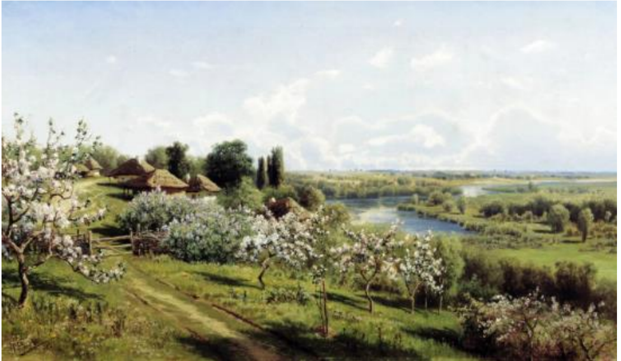
Картина М.О. Сергієва «Яблуні в цвіту»

8. Рослинність на картині виписано доволі детально, вона своїм кольором і розташуванням за угрупованнями допомагає відчутти ліричний настрій картини та підвищує естетичну привабливість ландшафту, поділяючи поверхню на чіткі ділянки, що урізноманітнює її вигляд.