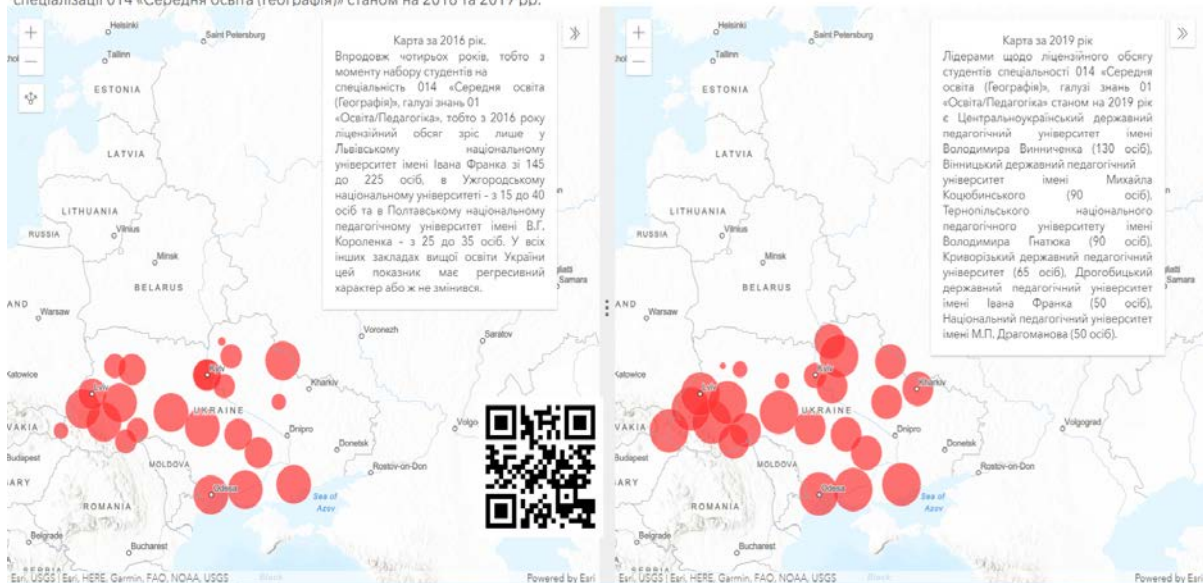
Рис. 1. Ліцензійний обсяг студентів I (бакалаврського) рівня вищої освіти, галузі знань 01 «Освіта / Педагогіка», спеціальності 014 «Середня освіта», освітньої програми «Географія» станом на 2016–2019 роки

Ліцензійний обсяг студентів I (бакалаврського) рівня вищої освіти, галузі знань 01 «Освіта/Педагогіка», спеціальності 014 «Середня освіта», предметної спеціалізації 014 «Середня освіта (Географія)» станом на 2016 та 2019 рр.