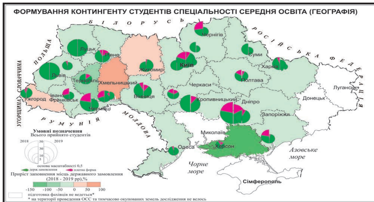
Рис. 3. Формування контингенту студентів I (бакалаврського) рівня вищої освіти галузі знань 01 «Освіта / Педагогіка», спеціальності 014 «Середня освіта», освітньої програми «Географія» станом на 2019 рік

Найбільша кількість абітурієнтів із високими показниками завнішнього незалежного оцінювання за спеціальністю 014 «Середня освіта (Географія)» у 2019 році обрала Львівський національний університет імені Івана Франка – 34 бюджетні місця, що становить 88% від ліцензійного обсягу. Наступний Державний вищий навчальний заклад «Криворізький національний університет», який отримав 32 місця від максимального обсягу державного замовлення, наповнюваність становить лише 63%. Східноєвропейський національний університет імені Лесі Українки за меншого показника максимального обсягу державного замовлення – 30 осіб – має наповнюваність 90%. Високий від-