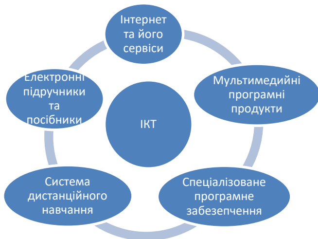
Рис. 2. Сучасні інформаційно-комунікаційні технології навчання