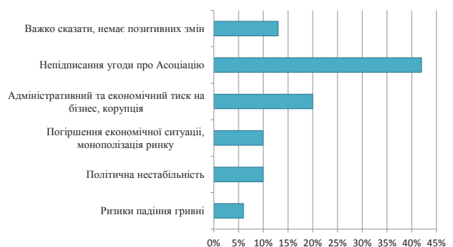
Рис. 3. Причини негативних змін в інвестиційному кліматі протягом 2013-2014 років

Так за результатами опитувань можна прослідкувати (рис. 3), що за 2013-2014 роки, після майже дворічних стабільно низьких експертних оцінок відбувається зріст індексу інвестиційної привабливості, що здебільшого пов'язують з підготовка до підписання Україною Угоди про Асоціацію з ЄС. Те, що ці очікування бізнесу не справдилися, призвело до суттєвого падіння індексу у 4-му кварталі 2013 року, до найнижчого рівня за всю історію його вимірювання – 1,81. Очікування на перший квартал 2014 року є також негативними, експерти вважають, що інвестиційний клімат в Україні буде й далі погіршуватися. Серед основних причин негативних змін в інвестиційному кліматі протягом 2013-2014 років опитані респонденти зазначають (рис. 3). Отже, одними із головних негативних змін у 4 кварталі 2013 року стали – відмова України від підписання Угоди про Асоціацію з ЄС, пов'язані з цим політична нестабільність, економічні ризики, в тому числі очікування падіння національної валюти.