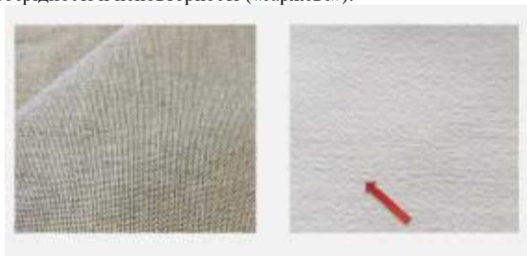
Рис. 2 Саржеве (зигзагоподібне)переплетення ниток полотна

тканини видимий діагональний рубчик, що надає їй своєрідності й неповторності («саржеве»).