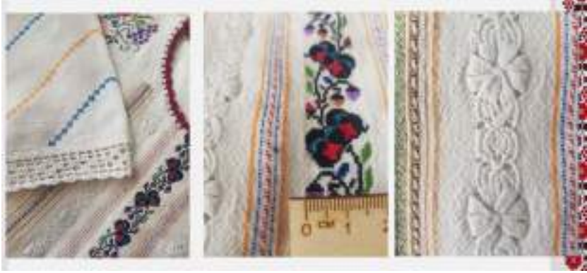
Рис. 3. Посаднання різних технік ручної роботи на вишиванці

Чоловіча вишивана весільна сорочка характеризується стриманим стилем, особливістю її був ковнір-стояк чи комірць-стійка, що на той час, за словами моєї бабусі, було надзвичайно «гоноровим». Вишитий комір доповнено білою ніжною витинанкою, яка надає вишиванці святковості.