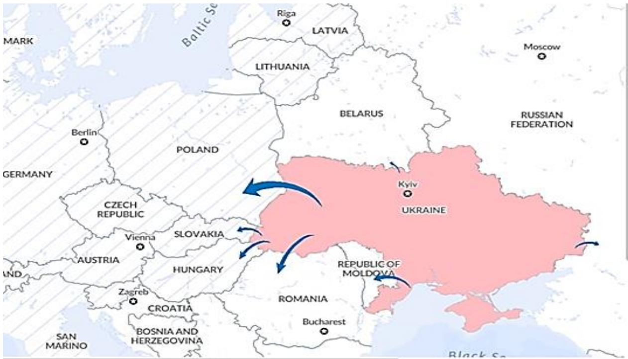
Малюнок 1. Міграція українців через збройний конфлікт

За даними ООН, загалом з початку збройного конфлікту з України виїхало 6801987 українців. Основними напрямками виїзду стали – Польща, Угорщина, Словаччина, Румунія, Молдова та інші країни Європи. Виїждять і до Росії, а також Білорусі (більш детально див. на Малюнку 1) [6].