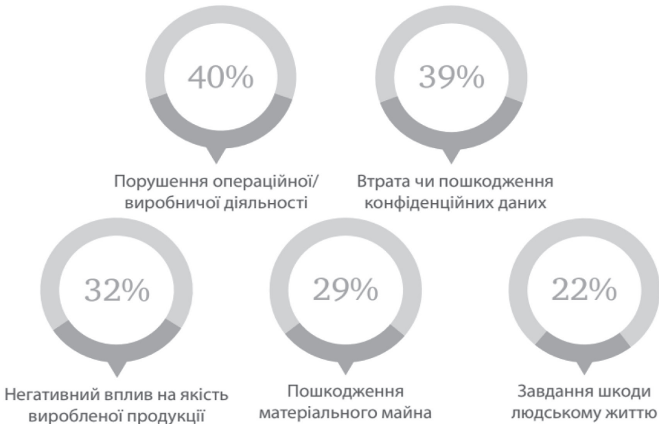
Рис. 2. Прогнозовані наслідки кібератаки на автоматизовані та / чи роботизовані системи

Прогнозовані ризики бізнесу, пов'язані з цифровою трансформацією, наведено на рис. 2 .