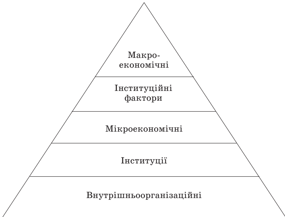
Рис. 1. Піраміда ризиків діяльності підприємств з урахуванням інституційних факторів

Тож удосконалена структура ризиків з урахуванням інституційного середовища розвитку бізнесу буде мати такий вигляд (рис. 1).