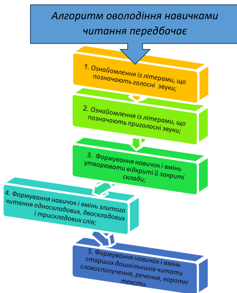
Рис. 3. Алгоритм оволодіння навичками читання

Структура індивідуальних, групових і корекційних занять ґрунтується на послідовному оволодінні уміннями та навичками, визначається поставленими завданнями і тривалістю дитячої працездатності, зумовленої віковими й індивідуальними особливостями дошкільників. Саме від цього залежить ефективність навчально-пізнавальної діяльності з мовленнєвого розвитку. Така організована діяльність включає серію інтегрованих, комплексних, комбінованих, сюжетних, бінарних занять та ігор-подорожей, мандрівок.