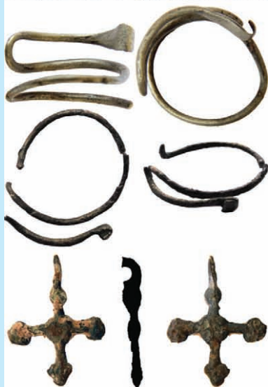
Поховання жінки з дитиною біля монастиря в Бакоті та скроневі кільця й хрестик з нього

З початку 1990-х рр. археологічні дослідження Бакотського монастиря проводила ціла плеяда незалежних вчених. У різні роки поруч із монастирем було виявлено серію давньоруських поховань. Часто давньоруські поховання виявляють під час облаштування стежок до монастиря. Одне з них досліджували в 2017 році.