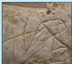
Скельно-печерний комплекс у с. Нагоряни (фото В. Галкіна, 2002 р.) і зображення на його стінах: хрести, антропоморфне зображення тощо