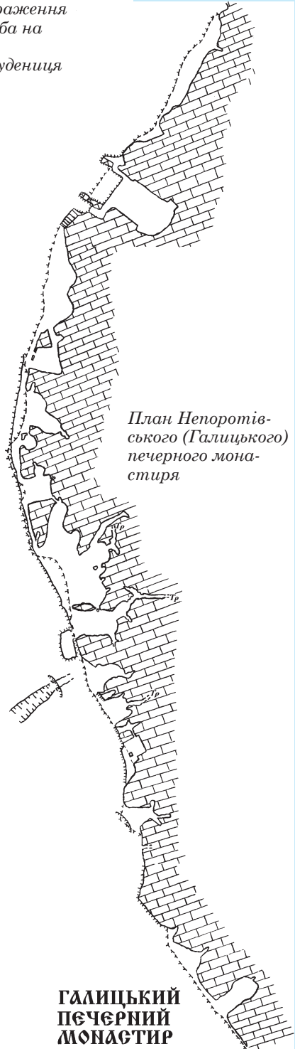
План Непоротівського (Галицького) печерного монастиря

Навколо Бакотського монастиря було виявлено цілу низку інших скельно-печерних пам'яток, пов'язаних із християнським культом. Одна з них розташована на урвищі Білої гори, поруч із затопленим містечком Студениця. Це комплекс, що складається з двох об'єктів: карстової печери та грота-навісу. В останньому, судячи із залишків апсиди, розміщувалася печерна церква. В її стелі було знайдено пази для дерев'яних конструкцій для встановлення стіни з боку каньйону. Грот-навіс має довжину 13 м. На стінах печерної церкви збереглося багато висічених зображень. Більшість із них — хрести з лунками, просвердленими на кінцях. Окремі хрести мають у верхній частині зображення людського обличчя. Є барельєфи, в яких вгадуються антропоморфні риси. Ці барельєфи теж вкриті зображеннями. Найцікавіше з них — двозуб із відігнутими кінцями. Це не єдина знахідка тамгоподібного знаку в скельно-печерних пам'ятках каньйону Дністра. Про ще одне подібне зображення трохи згодом. Повних аналогій Студеницькому двозубцю поки що не знайдено. Однак, у літописному місті Василів на Дністрі відомі зображення двозубців на кришці давньоруського