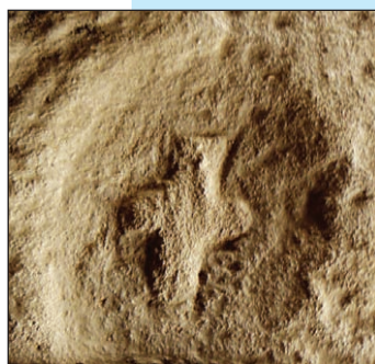
Тамгоподібний знак і хрест на підлозі зі скельно-печерного комплексу біля с. Василівка