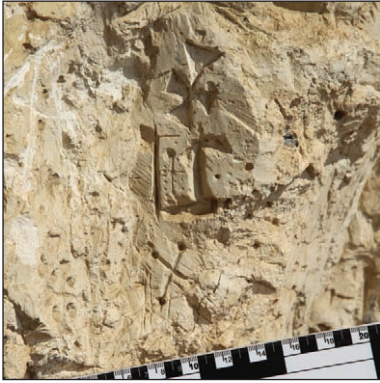
Наскельне зображення хрестів і двозуба на стіні печерної церкви у с. Студениця

Навколо Бакотського монастиря було виявлено цілу низку інших скельно-печерних пам'яток, пов'язаних із християнським культом. Одна з них розташована на урвищі Білої гори, поруч із затопленим містечком Студениця. Це комплекс, що складається з двох об'єктів: карстової печери та грота-навісу. В останньому, судячи із залишків апсиди, розміщувалася печерна церква. В її стелі було знайдено пази для дерев'яних конструкцій для встановлення стіни з боку каньйону. Грот-навіс має довжину 13 м. На стінах печерної церкви збереглося багато висічених зображень. Більшість із них — хрести з лунками, просвердленими на кінцях. Окремі хрести мають у верхній частині зображення людського обличчя. Є барельєфи, в яких вгадуються антропоморфні риси. Ці барельєфи теж вкриті зображеннями. Найцікавіше з них — двозуб із відігнутими кінцями. Це не єдина знахідка тамгоподібного знаку в скельно-печерних пам'ятках каньйону Дністра. Про ще одне подібне зображення трохи згодом. Повних аналогій Студеницькому двозубцю поки що не знайдено. Однак, у літописному місті Василів на Дністрі відомі зображення двозубців на кришці давньоруського