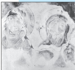
Давньоруські написи та фрески з монастиря у Бакоті. Фото XIX ст.