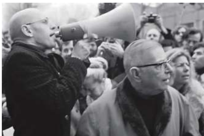
Мішель Фуко та Жан-Поль Сартр.

Ж. Дельоз відзначає, що Фуко завжди все розглядав у якості експерименту, починаючи із студентських років, коли він регулярно відвідував психіатричні лікарні. Ця практика наштовхнула на дослідження станів суспільства («Наглядати і карати», 1975) – генеалогічний етап його наукової діяльності також пов'язаний із радикальним оновленням дослідницької оптики вченого.