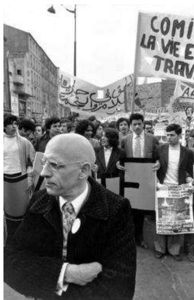
Мішель Фуко на демонстрації працівників-мігрантів, 1973.