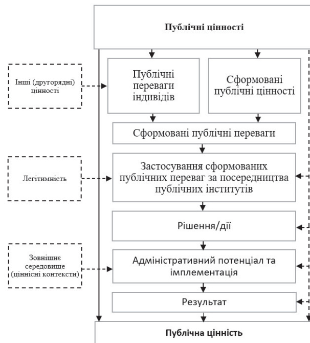
Рис. 3. «Динамічна модель публічних цінностей» Єви Вайтсман [11, с. 30]

Реалізацію ідеї дослідниці видно на прикладі її власної моделі (рис. 3). У ній можна побачити елементи попередніх моделей, наприклад, участь ціннісних контекстів у формуванні публічної цінності. Однак, на нашу думку, дослідниця дарма випустила з уваги циклічність процесу, постульованого М. Муром.