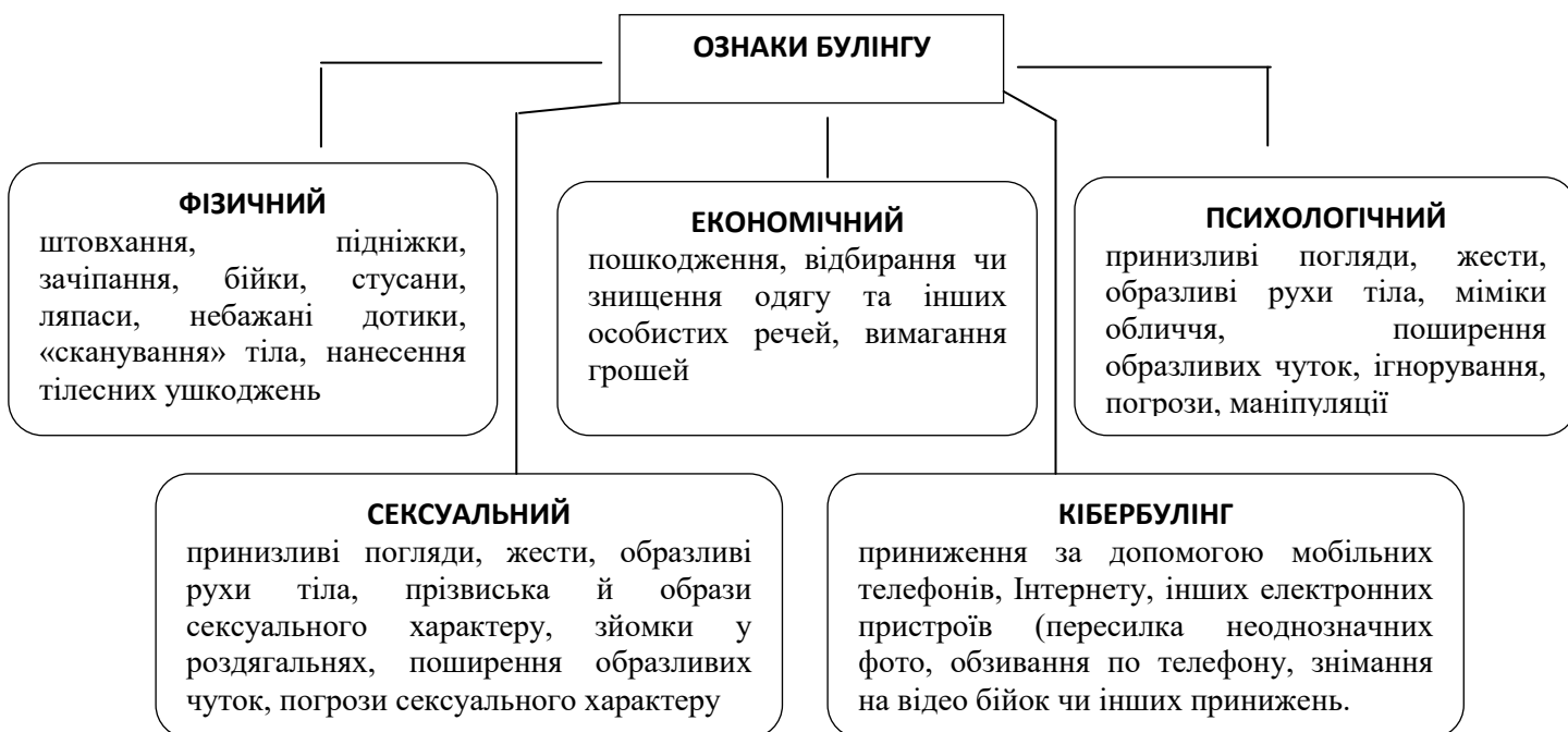
Рис. 2. Ознаки боулінгу (згідно Закону України «Про внесення змін до деяких законодавчих актів України щодо протидії боулінгу (цькуванню)») [1]

Кожен з видів боулінгу характеризується своїми ознаками та проявами,за якими можна ідентифікувати ситуацію боулінгу (рис.2.):