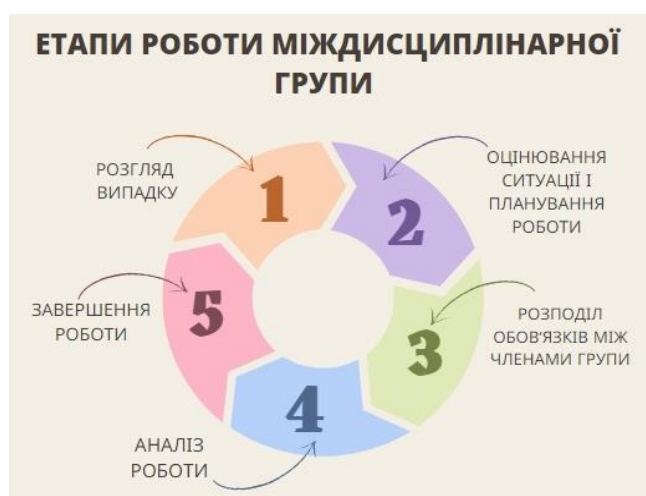
Рис.2. Етапи роботи міждисциплінарної групи

Команда, застосовуючи інтерактивний підхід, для надання більш якісних послуг взаємодіє з іншими соціальними службами, чи передає їм роль лідера у наданні цільових послуг. Етапи роботи міждисциплінарної групи (рис. 2):