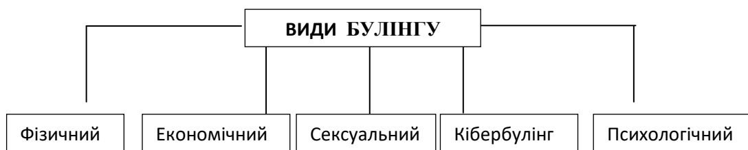
Рис.1.Види боулінгу (згідно Закону України «Провнесення змін до деяких законодавчих актів України щодо протидії боулінгу (цькуванню)») [1]

Є важливим впровадження ефективних методів та форм роботи, які спрямовані на протидію булінгу (цькування), – запроваджувати системний підхід до профілактики цього явища, кожного виду булінгу – економічного, фізичного, психологічного та сексуального та кібербулінгу (рис. 1).