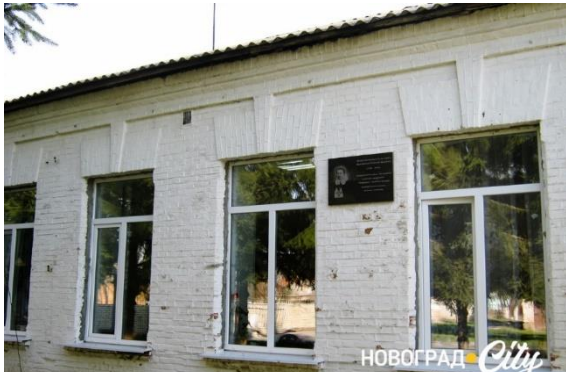
Рисунок 1. Будівля амбулаторної лікарні у Новограді, сучасний вигляд.

амбулаторію. Проте розпочала вона свою роботу наступного року [4, с. 82; 5, с. 165]. В 1911 р. підготовка кваліфікованого молодшого медперсоналу була висунута на перший план. Курси сестер милосердя запрацювали в Житомирі. Кошти на їх утримання виділив місцевий комітет Червоного Хреста під керівництвом М.С. Куйтасової. З цією метою проведено два спектаклі, виручка