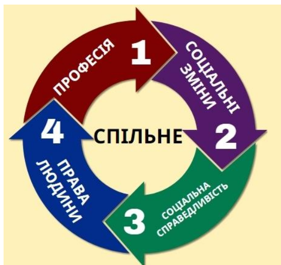
Рис. 1. Взаємозв'язок соціальної роботи

Разом з тим порівнюючи міжнародні визначення соціальної роботи можна відмітити спільне (рис. 1):