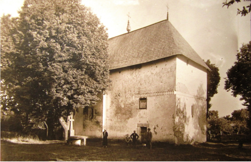
Фото 1. Старовинна церква св. Іллі в Топорівцях (фото Л. Балана).

був домом Божим і родинною усипальницею, мав також оборонне значення. До прямокутної нави з невеличкими бічними конхами, схованими в товщі стін примикає зі сходу півкругла апсида вітваря, а із заходу прямокутний притвор. Зовнішній вигляд характеризується цільністю об'єму, покритого високим чотирисхилим, покритим дранкою, дахом, гребінь якого увінчаний трьома залізними хрестами. Гладкі й масивні за рахунок відсутності великих світлових прорізів стіни, розділено незначними виступаючими креповками і горизонтальним пояском поребрика. Прямокутні невеличкі вузькі з арковим завершенням вікна виділені різьбленим обрамленням. Вхід прорізано в північній стіні притвору. Вхідні двері з кам'яними обрамленням в готичному стилі колись були маленькі. Об'єми притвору та нави розділені підпружною аркою. Цей отвір був розширений приблизно в 1870 р. на місці маленьких дверей із замками. У церкві був іконостас, який датувався приблизно 1880 р. Притвор перекритий склепінням, що опирається на врізані в стіни неглибокі підпружні арки. Четверик нави через паруси перекритий сферичним склепінням. Центральний об'єм вищий за бічні. На горищі по всьому периметру стін зберігся парапет з бійницями. Інтер'єр храму, як свідчив К. А. Ромшторфер, колись прикрашав