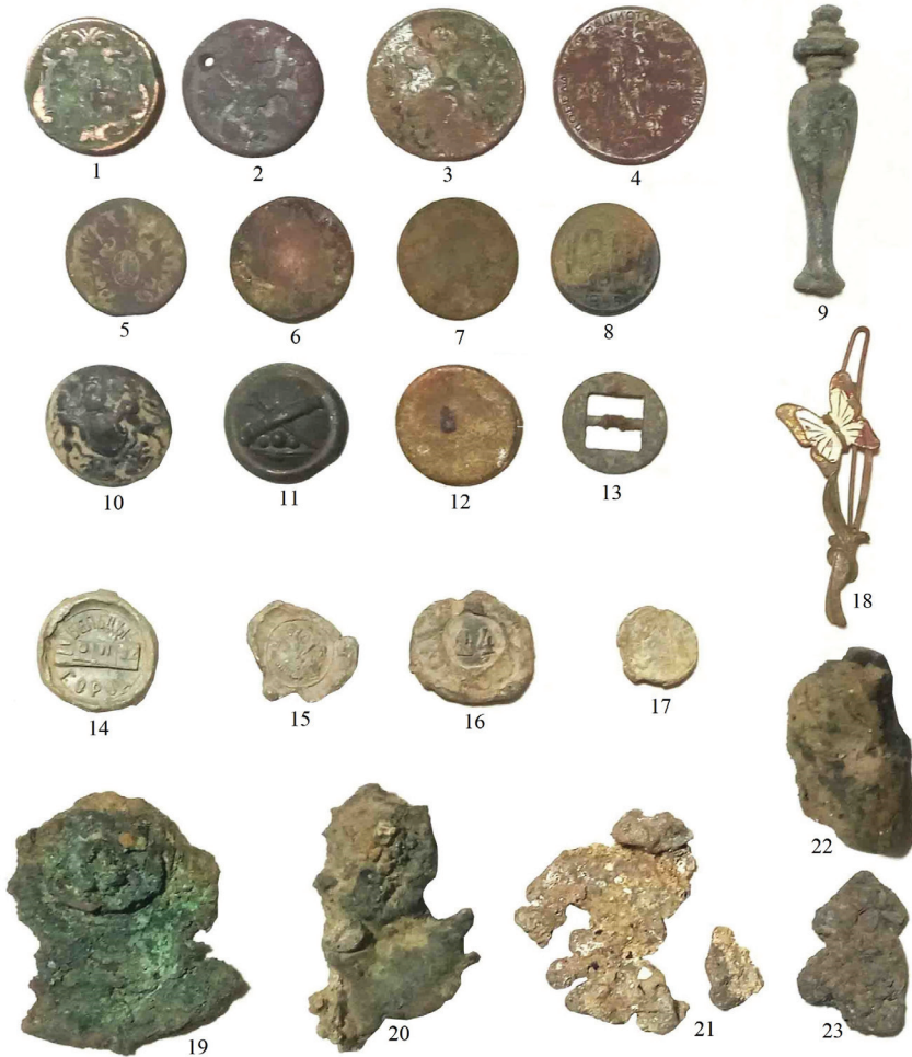
Рис. 2. Артефакти із Садгори.

Схожі знахідки були виявлені й під час огляду території костелу Найсвятішого Серця Ісуса. Тут також знайдено 10 різночасових монет, свинцеві пломби та декілька гільз від австрійських гвинтівок. Найбільш цінною знахідкою цієї локації став срібний знак на кепі австро-угорського солдата періоду Першої Світової війни. Знак виготовлений у вигляді хреста, в його центрі у медальйоні зображено профілі імператорів Франці Йосифа II та Вільгельма II. На його верхньому рамені розміщена корона, а на нижньому дата 1914 р. Такого типу знаки відносять до серії «патріотика» й були