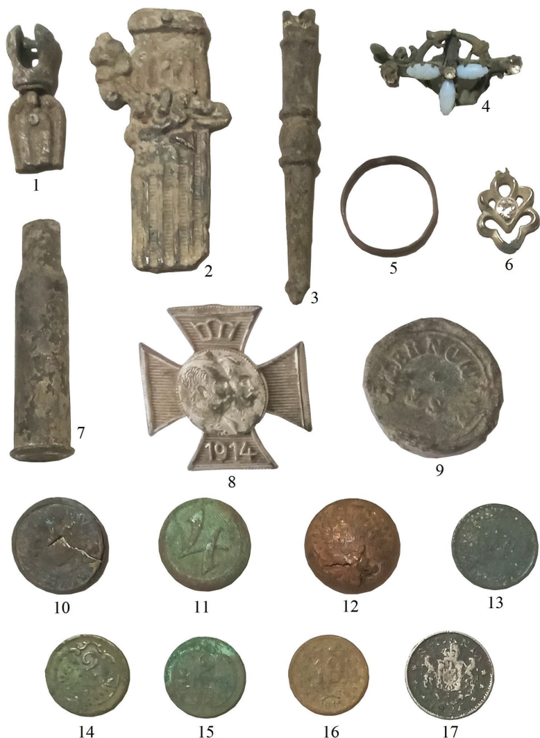
Рис. 1. Знахідки із скверу Дня Вишиванки та костелу Найсвятішого Серця Ісуса.

обов'язковим атрибутом уніформи буковинських чиновників. Цікавими є знахідки 6 свинцевих пломб, якими опечатувалися різноманітні товари й вантажі. З-поміж них, окрім австро-угорських, зустрічаються й російські – періоду Першої Світової війни.