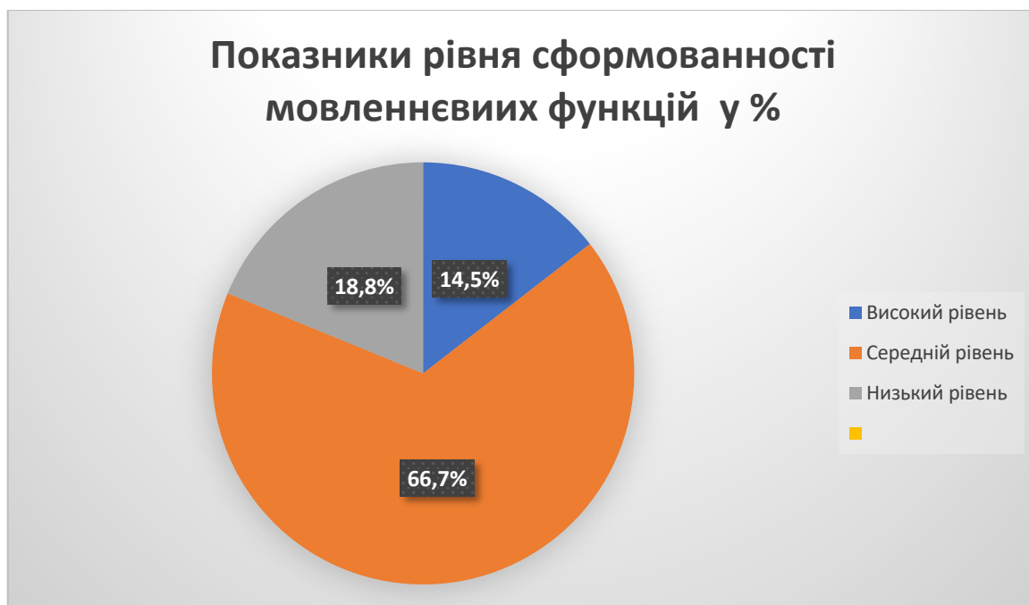
Рис.2.1.Рівні сформованості мовленнєвих функцій зв'язного мовлення

Аналізуючи результати ми бачимо, що частина учасників дослідження (14,5%) виявили високі мовленнєві навички, тоді як більшість (66,7%) були на середньому рівні. І досить велика частина дітей (18,8%) виявили низький рівень мовленнєвих навичок. Ці результати вказують на різноманітність рівня розвитку зв'язного мовлення серед дітей дошкільного віку та на важливість цілеспрямованої роботи з розвитку мовленнєвих навичок у цій віковій групі.