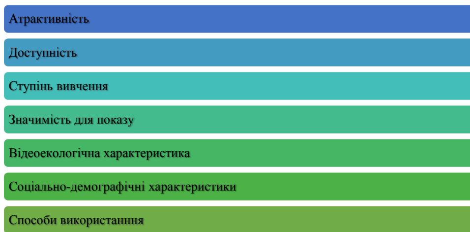
Рисунок 1.1. Властивості туристичних ресурсів

Виділяють такі властивості туристичних ресурсів (рис.1.1)