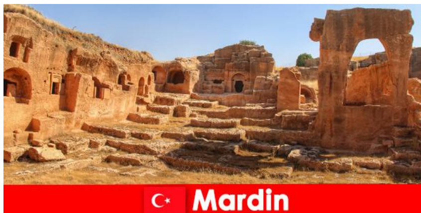
Рисунок 3.1. Стародавні монастирі і церкви в Мардіні, Туреччина

Провінція Мардін є прикладом культурного розмаїття турецьких міст. Мардін був центром толерантності протягом кількох століть і тут проживає лише близько 185 000 жителів.