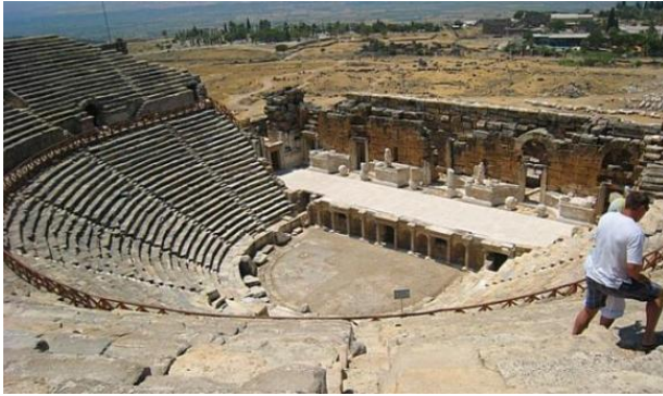
Рисунок 3.3. Палац Топкапи, Стамбул

Відомо, що відвідування архітектурних пам'яток входить в програму всіх екскурсій. Серед визначних пам'яток можна виділити наступні: