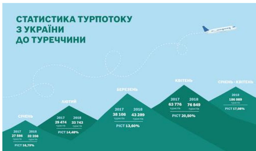
Рисунок 3.1. Статистика турпотоків з України до Туреччини

Потік українських туристів до Туреччини досяг рекордного показника в більш ніж 1,2 млн чоловік за 10 місяців 2017 року. У період січень-жовтень Туреччину відвідали 1 212 644 українців, що на 23,39% більше порівняно з аналогічним періодом 2016 року. Найбільшою популярністю серед жителів України користуються курорти провінції Мугла (Бодрум, Даламан, Фетхіє і Мармарис), а також Анталія і Стамбул.