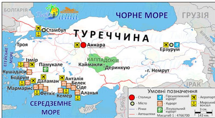
Рисунок 2.1. Популярні курорти Туреччини

У цей період температура повітря встановлюється на відмітці +30^{\circ} . Останнім часом особливо привабливими для туристів стали райони південного узбережжя Туреччини : Анталія, Кемер, Аланія, Белек, Бодрум, Кемер, Кушадаси, Мармарис, Паландокен, Сіде, Стамбул, Улудаг, Фетхіє (рисунок 2.1).