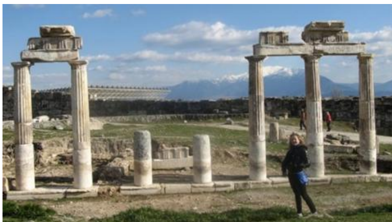
Рисунок 3.2. Церква св. Ірини, Стамбул

Церква Святої Ірини, побудована в 4 столітті, розташована на території музейного комплексу Топкапи. До речі, присвячений він не святій Ірині, а Святому Світу. У 381 році тут відбувся Другий Вселенський Собор. Сучасна будівля датується 6 століттям. Оскільки церква не використовувалася як мечеть, зберігся атриум – просторе високе приміщення при вході. Сьогодні храм використовується як концертний зал.