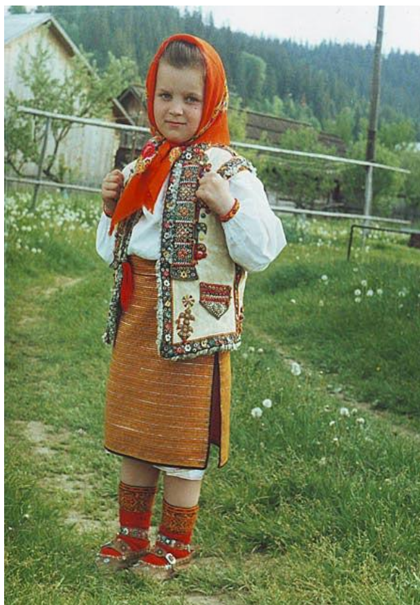
Рисунок 2.1. Традиційний одяг гуцулів

Зберігаються у гуцулів і патріархальні традиції гірського скотарства: вівчарство вважається суто чоловічою справою. Пастухи упродовж усього теплого сезону кочують полонинами зі своїми отарами (Рис. 2.2.). Саме завдяки цьому вони зберегли древні обряди, пов'язані з культом вогню і мисливця-воїна. У пастушому середовищі склалася самобутня кухня, зорієнтована в основному на споживання м'ясних та молочних страв (бараняче м'ясо, гусянка, бринза).