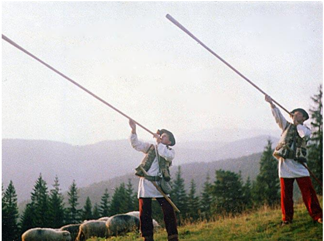
Рисунок 2.2. Традиційне ремесло гуцулів - вівчарство

дотриманням усіх ритуалів давньослов'янської тризни і помани у поховальній обрядовості тощо.