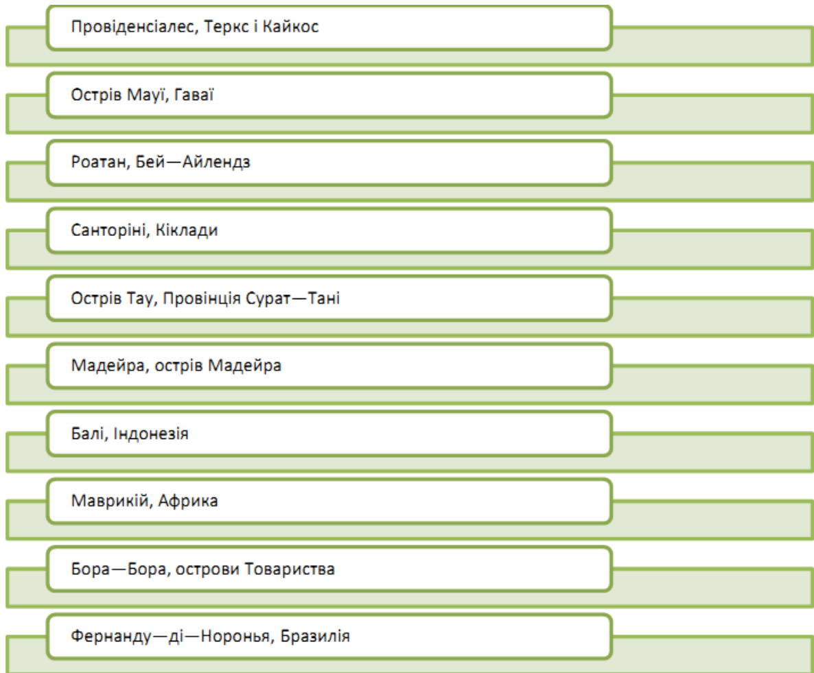
Рис. 3.3. Рейтинг найкращих островів світу за версією TripAdvisor

В 2019 році користувачі порталу TripAdvisor створили список найкращих островів планети, у якому Балі посів почесне 7 місце.