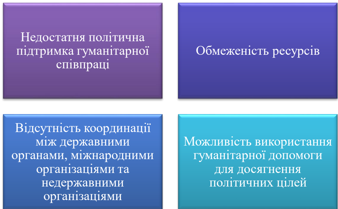
Рис.3.1. Основні проблеми та виклики в реалізації гуманітарної дипломатії України та Румунії (Автор: М. Колотило)

Успішні проєкти і ініціативи в гуманітарній сфері вже довели свою ефективність, але одночасно існують певні проблеми та виклики, які потребують уваги та розв'язання. Однією з таких проблем є необхідність забезпечення сталої фінансової підтримки гуманітарних проєктів. Завдяки спільним зусиллям України та Румунії було реалізовано численні ініціативи, але для їх успішної імплементації важливо забезпечити стабільний фінансовий фонд[58].