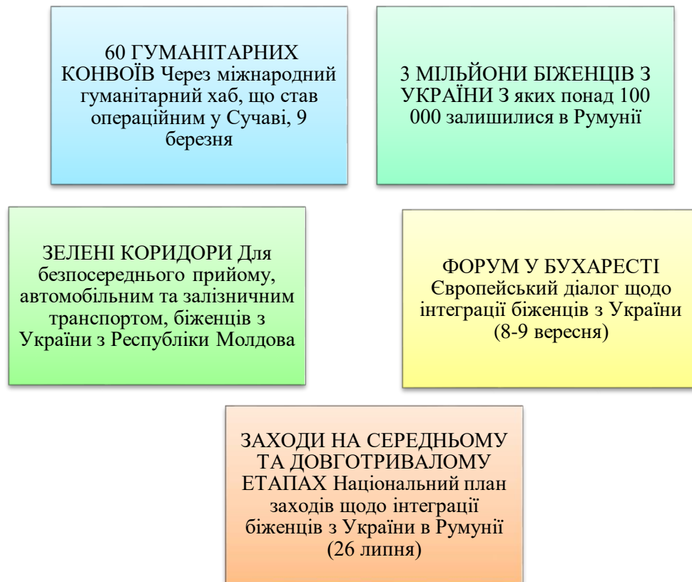
Рис. 2.1. Форми гуманітарної дипломатії Румунії щодо України (Автор: М. Колотило)

Румунія, за посередництвом Міністерства закордонних справ, активно брала участь у дипломатичних заходах на багатосторонньому рівні з метою підтримки України та засудження агресії Росії проти України, зокрема на рівні Ради Безпеки та Генеральної Асамблеї Організації Об'єднаних Націй, і надала доступ установам ООН, таким як Світова продовольча програма, для сприяння розподілу гуманітарної допомоги Україні[41].