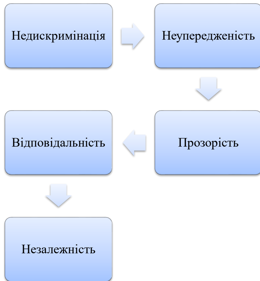
Рис.1.1. Принципи гуманітарної діяльності Румунії (Автор: М. Колотило)

Ці принципи є основою гуманітарної етики та забезпечують високий стандарт діяльності в умовах надзвичайних обставин.