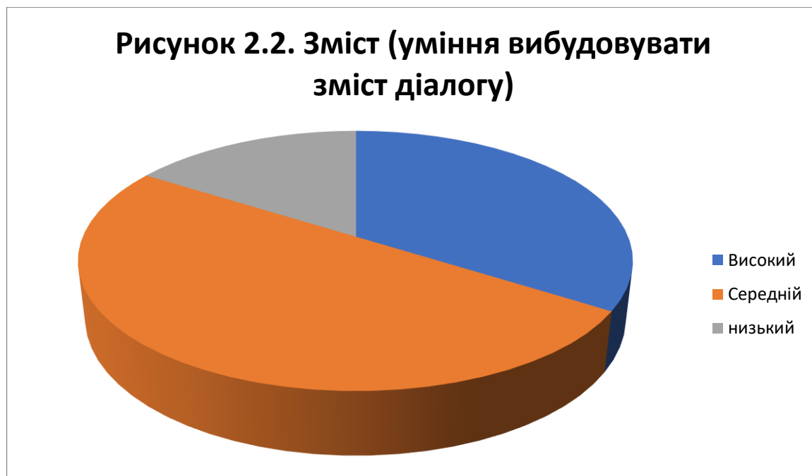
Рис.2.2. Оцінка рівня розвитку умінь діалогічного мовлення за критерієм «Зміст»

Аналіз даних показує, що 34% респондентів мають високий рівень розвитку умінь діалогічного мовлення за даним критерієм, 50% опитаних володіють середнім рівнем і 16% – низьким.