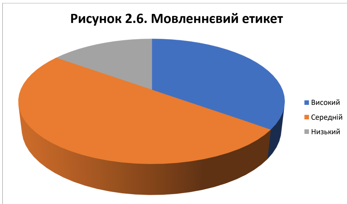
Рис. 2.6. Оцінка рівня розвитку умінь діалогічного мовлення за критерієм «Мовленнєвий етикет»

42% (21учень) мають високий рівень мовного етикету, що може бути результатом ефективного навчання та виховання. 60% (30 учнів) мають середній рівень мовного етикету, що говорить про те, що більшість учнів у дослідженні знаходяться на середньому рівні розвитку мовного етикету. 18% учнів мають низький рівень мовного етикету. Це може бути показником необхідності додаткової уваги та підтримки для цієї групи учнів у плані розвитку мовного етикету.