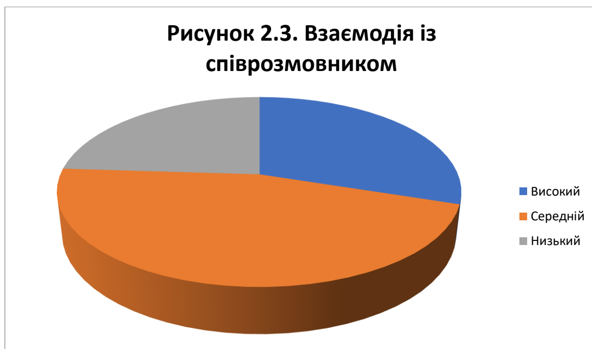
Рис. 2.3. Оцінка рівня розвитку умінь діалогічного мовлення за критерієм «Взаємодія із співрозмовником»

Як видно з діаграми 2.3., 15 учнів (30%) мають високий рівень розвитку умінь діалогічного мовлення за даним критерієм, 23 опитаних (46%) – середній та 12 (24%) – низький рівень.