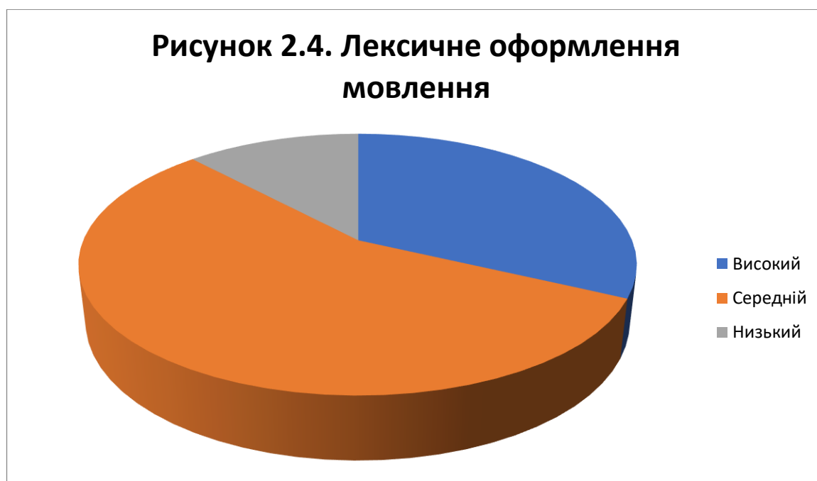
Рис. 2.4. Оцінка рівня розвитку умінь діалогічного мовлення за критерієм «Лексичне оформлення мовлення»

Аналіз даного критерію показує високий рівень розвитку умінь діалогічного мовлення у 16 респондентів (що складає 32%), середній рівень – у 28 учнів (56%) та низький рівень у 6 опитаних (12%).