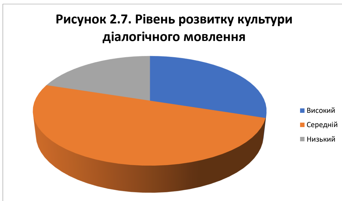
Рис. 2.7. Зведені результати діагностики рівня розвитку культури діалогічного мовлення молодших школярів

критеріями оцінювання рівня культури діалогічного мовлення молодших школярів представлена на рис.2.7.