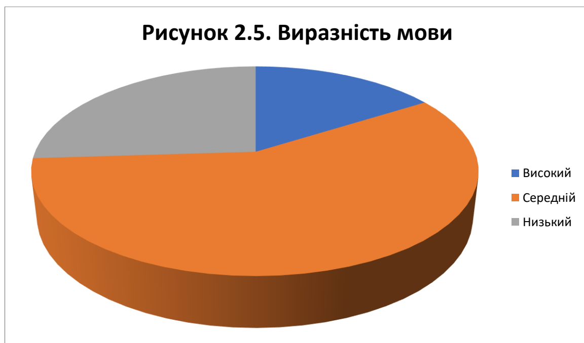
Рис. 2.5. Оцінка рівня розвитку умінь діалогічного мовлення за критерієм «Виразність мови»

Результати показують, що лише 8 учнів (тобто 16% респондентів) мають високий рівень розвитку таких умінь діалогічного мовлення, як темп і виразність мови, 29 осіб (що становить 58%) – середній рівень і 13 опитаних (26%) – низький. Такий результат свідчить про те, що розвитку названих умінь приділяється недостатня увага і в школі, і поза навчальним закладом.