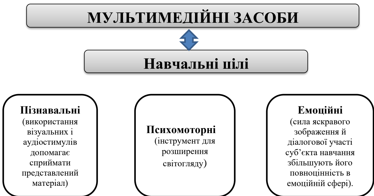
Рис 1.1 Навчальні цілі мультимедійних засобів навчання

Застосування мультимедіа, за переконанням О.Данилова, є доцільним через такі навчальні цілі (рис.1.1).