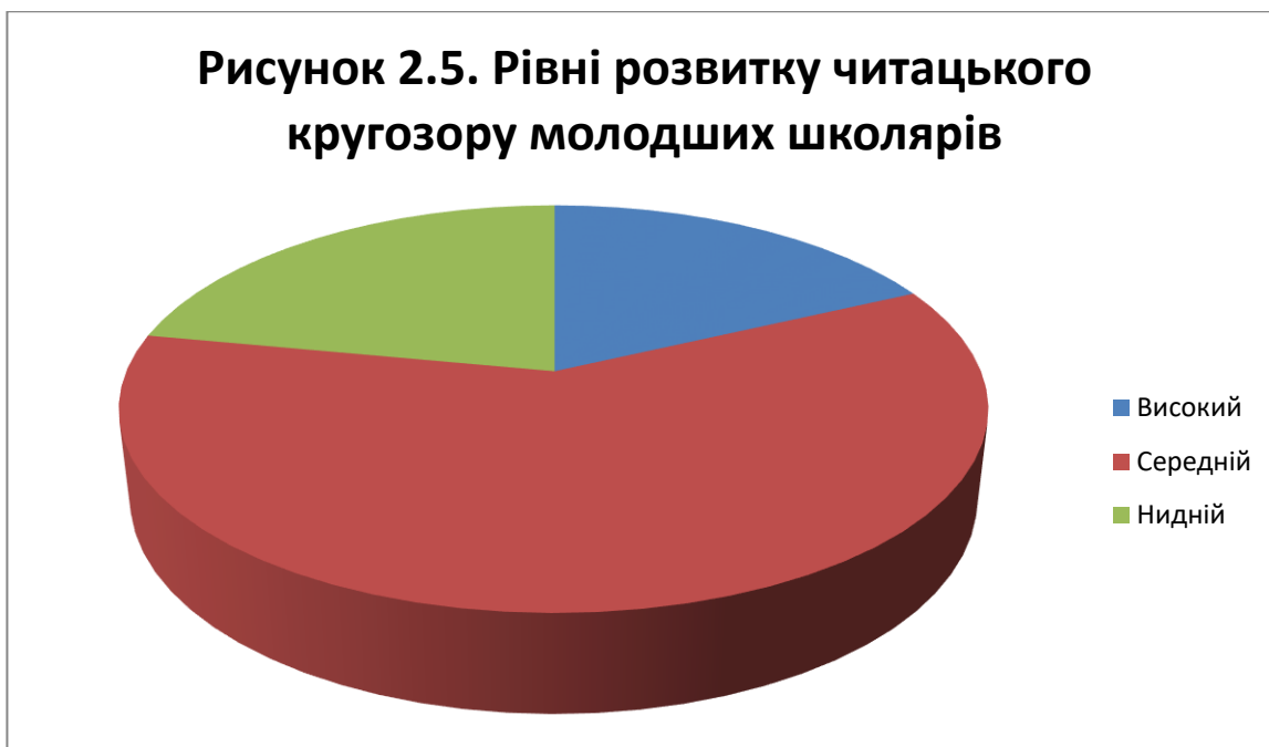
Рисунок 2.5. Рівні розвитку читацького кругозору молодших школярів

У процесі діагностики було виявлено, що школярі в цілому не дуже добре орієнтуються в світі книг, мають нестійкий інтерес до уроків літературного читання, не зовсім вміють працювати з текстом, знаходити головну думку, однак читацький кругозір сформований тільки на основі літератури, включеної в навчальну програму.