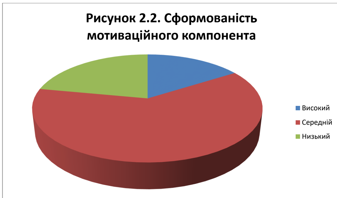
Рисунок 2.2. Сформованість мотиваційного компонента

Загальний аналіз показує, що більшість учнів мають середні мотиваційні рівні, якщо йдеться про бажання знайомитися з новими творами та прагнення до засвоєння літературознавчих знань. Однак важливо пам'ятати, що існують учні з високим інтересом, які можуть потребувати додаткового виклику, а також ті, які мають низьку мотивацію і можуть потребувати більше підтримки для розвитку цього інтересу.