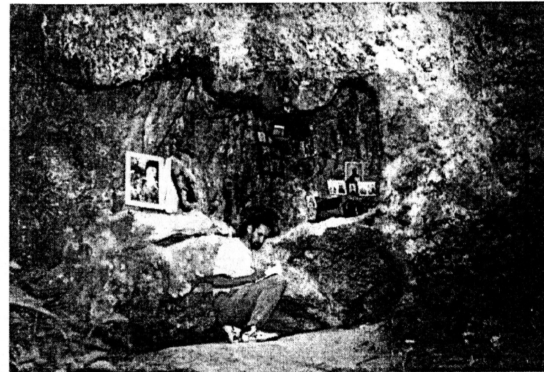
Рисунок 4. Печерна каплиця у с.Хрещатик

кількох келій у скелях, а також залишки скельної монастирської церкви. Було виявлено давньоруські написи XI-XIII ст. Слід гадати, що й у Василеві існував печерний монастирський комплекс, аналогічний до Бакотського чи Галицького, і ретельне дослідження цього об'єкту дозволить поповнити вітчизняну культурно-історичну спадщину ще однією видатною пам'яткою підземної архітектури.