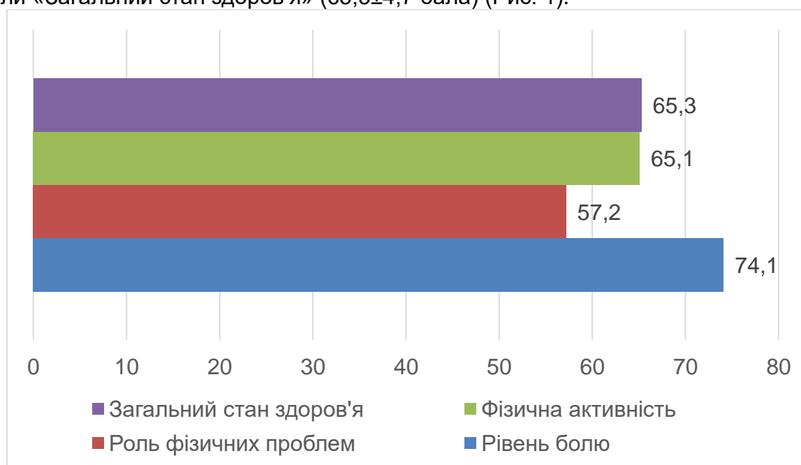
Рис. 1. Компоненти якості життя внутрішньо переміщених жінок: фізичний компонент, (n = 20), ум.од.

Показники шкали «Рівень болю» ( 74,1 \pm 6,7 бала) свідчать про значне обмеження активності респонденток, неможливість займатися щоденними справами у зв'язку із больовими відчуттями. Результати оцінки за шкалою «Роль фізичних проблем в обмеженні життєдіяльності» вказують на зв'язок між фізичним станом та виконанням повсякденних завдань. Серед досліджуваних вони становлять 57,2 \pm 5,7 бала, що є характерним для осіб з гострими чи хронічними захворюваннями. Значення 65,1 \pm 3,9 бала за шкалою «Фізична активність» у респонденток вказує на суттєві обмеження щоденної рухової діяльності досліджуваних у зв'язку із тривалим перебуванням у бомбосховищах, наявністю проблем з виконанням щоденних дій: переміщені, подоланні дистанцій, перенесенні важких речей. Низькими є показники шкали «Загальний стан здоров'я» ( 65,3 \pm 4,7 бала) (Рис. 1).