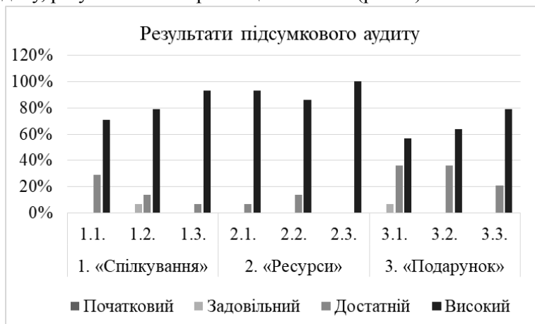
Рис. 2. Результати підсумкового аудиту

Наступний етап дослідження – розвивальна робота, яка тривала з жовтня 2023 по лютий 2024 р. Вихователями групи здійснювалася реалізація парціальної програми «Дошкільнятам – освіта для сталого розвитку» [2] у форматі тематичних днів. По завершенні проходження всіх тем («Спілкування», «Ресурси» та «Подарунок») та їх підтем, передбачених програмою, було здійснено повторний збір даних із проведенням підсумкового аудиту, результати яких розміщено нижче (рис. 2):