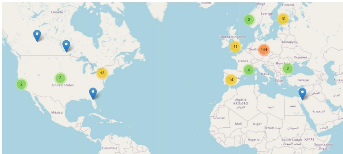
Рис. 1. Мапа Української наукової діаспори в світі [12].

Ми все ще на початковому етапі перехресного обміну ідей і створення нових дослідницьких програм. Проте українці швидко навчаються, і це сприятиме ефективному вирішенню проблем повернення (тимчасове, часткове, онлайн, співробітництво, економічний та інноваційний слід, інвестиції). Одним із прикладів української практики є мережа «Українська наукова діаспора», яка представлена майже в кожній країні світу. Українські науковці об'єдналися у Глобальну дослідницьку мережу [11]. З цією ініціативою виступили Міністерство освіти і науки України, Рада молодих вчених та Офіс підтримки вченого. Мережа дає змогу обмінюватися досвідом один з одним, різноманітними ресурсами та даними, що прискорює наукові відкриття та інновації. Створено мапу українських науковців у світі, для швидкого пошуку партнерів у грантовій активності та розвитку міжнародних відносин.