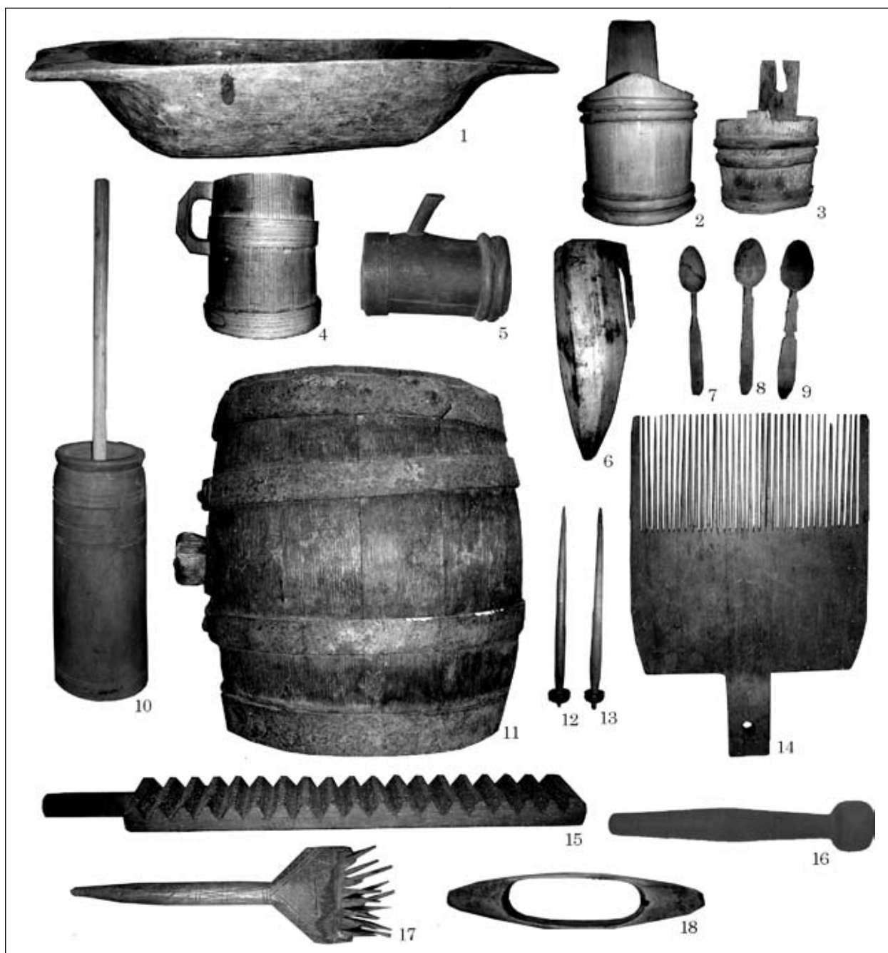
Рис. 1. Дерев'яні вироби XIX — першої половини XX ст. з теренів Північної Буковини

ду, що виявлені на городищах Чорнівка, Недобойці, містах Ленківцях на Пруті, Василеві (Возний 2009, с. 213).