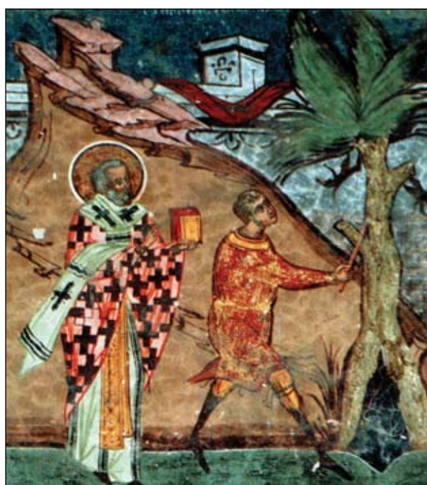
Рис. 4. Робота сокирою, зображення в церкві св. Іоана Ботезата в монастирі XV—XVI ст. у Гуморулуї (Південна Буковина, Румунія) (за: Solcanu 2002)

У давньоруські часи досить поширеним був дерев'яний посуд, що забезпечувалося наяв-