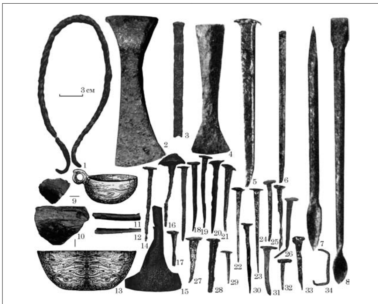
Рис. 2. Знаряддя та предмети, пов'язані з деревообробним ремеслом: 1 — дужка до відра; 2 — сокира, 3, 4 — долото; 5, 13 — тесло; 6 — кріпильний стержень; 7—8 — свердло; 9—10 — дерев'яний посуд; 11—12 — дерев'яні кілки; 14—33 — цвяхи; 34 — скоба (1—3, 6—12, 14—16, 34 — Чорнівка; 4, 21—27 — Ленківці на Пруті; 5 — Недобоївці; 13, 28—33 — Зелена Липа; 17—20 — Василів)

тощо (Козловський 1990, с. 38; Шекун, Веремейчик 1999, рис. 65: 31; Прищеп 2016, с. 96).