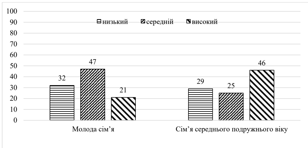
Рис. 1. Рівень прояву загального показника особистісної зрілості серед сімей молодого та середнього подружнього віку (у %)

ними: особистісна зрілість ( U_{emp}=332 ; p=0,041 ), життєва філософія ( U_{emp}=400 ; p=0,001 ), автономність ( U_{emp}=330,00 ; p=0,040 ), самосприйняття ( U_{emp}=354 ; p=0,006 ), відповідальність ( U_{emp}=328 ; p=0,025 ).